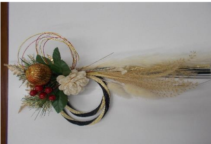
フラワーアレンジメント教室