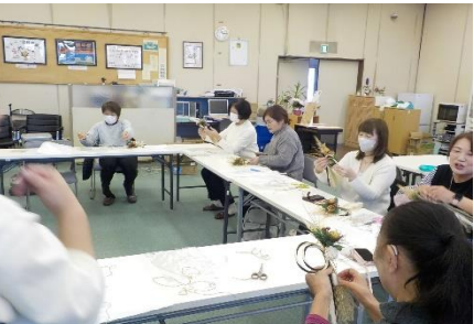
フラワーアレンジメント教室