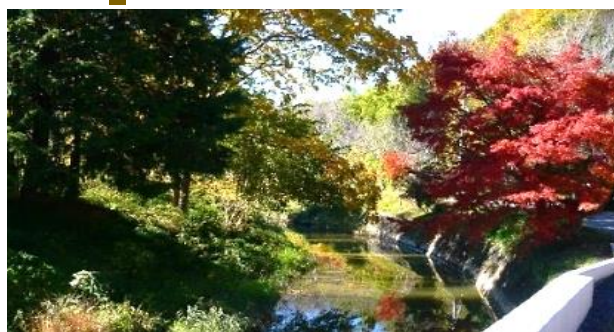
前回のここはどこでしょうの写真