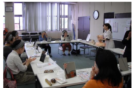
フェイシャルエステ