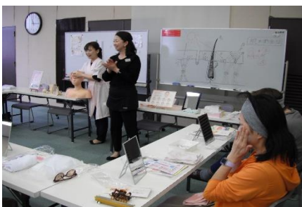
フェイシャルエステ