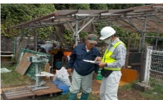
シルバー堆肥場・作業