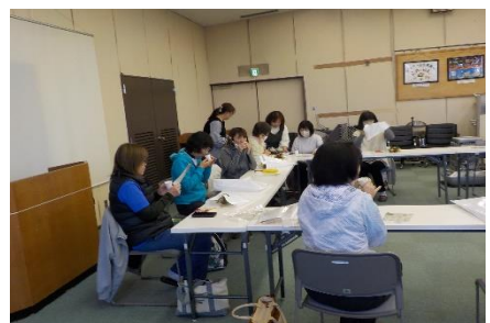
フラワーアレンジメント教室