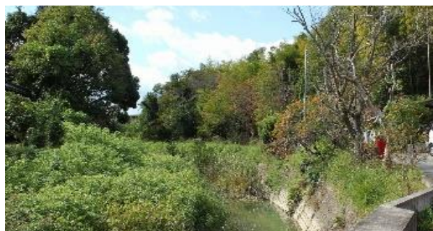
左の写真の現在の風景

J R 下粕駅沿いに府道八幡木津線を北へ行くと煤谷川があり、川沿いを西へ300m程のところからこの景色が見られました。11年前にふるさと発見の旅で歩きました。参加者から「精華町に40年住んでいるけどこんなところがあったんですね、感動しました。」と言ってもらえた川沿いの景色です。