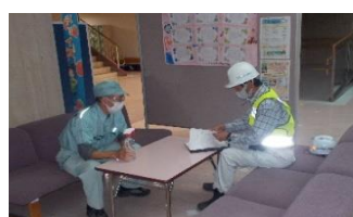
かしのき苑・屋内清掃