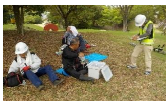
畑ノ前公園・除草