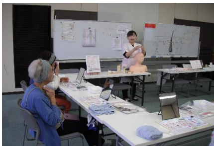
フェイシャルエステ