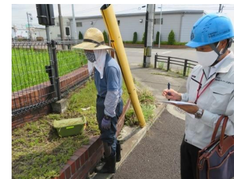
手刈り班の作業現場訪問