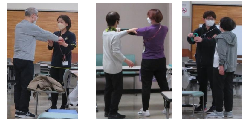
おひとり、おひとり丁寧にチェックをいたしました