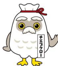
全国シルバー人材センター ゆるキャラ チエブクロ