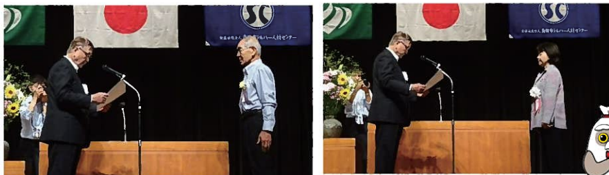
役員・会員表彰授与の様子