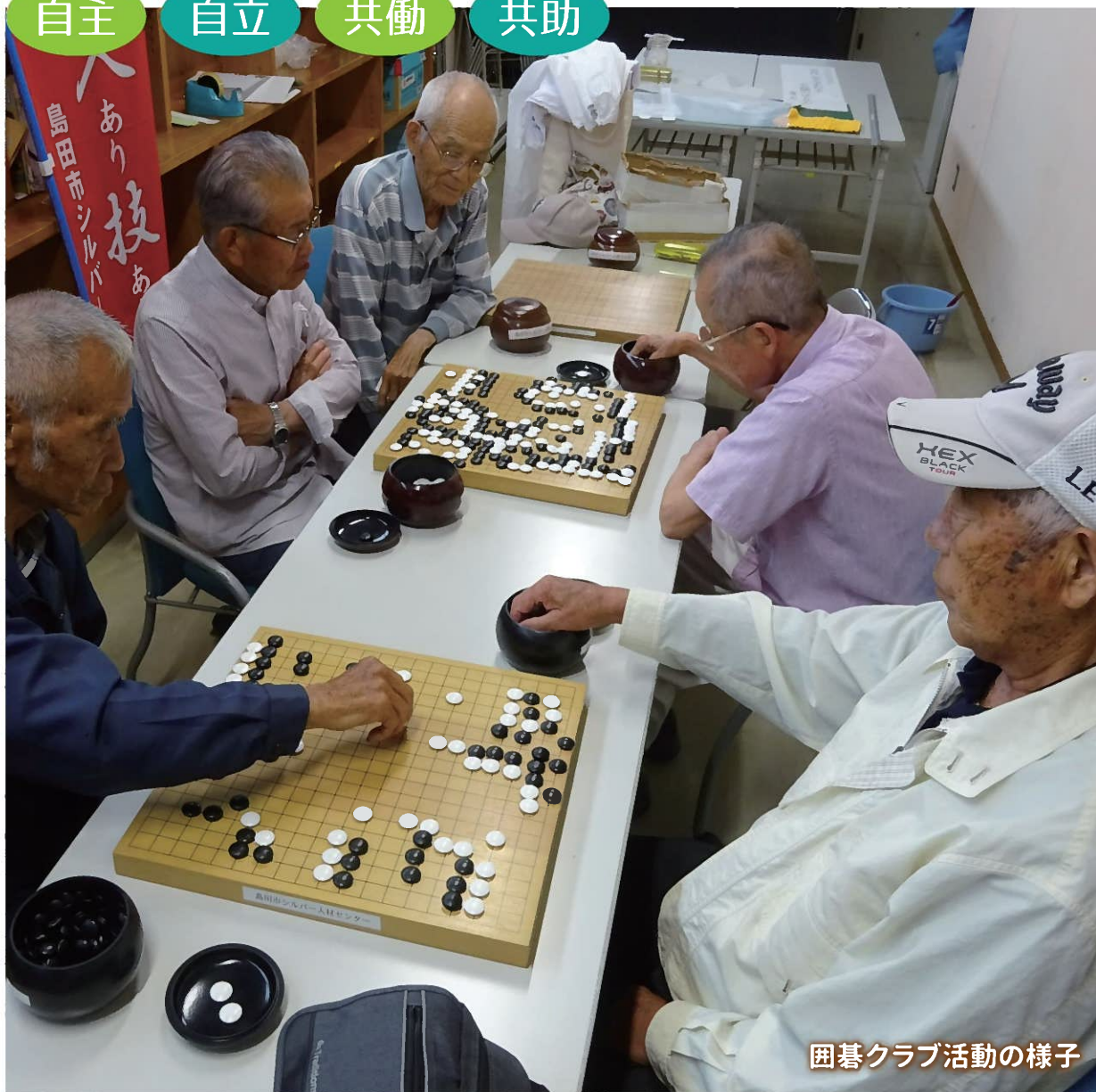
碁碁クラブ活動の様子