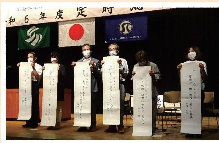
総会での表彰の様子