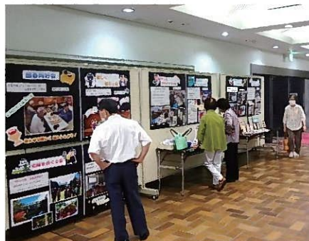
サークル活動紹介・作品展示