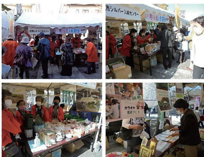
手芸サークル作品販売

島田市の産業祭が3年ぶりに開催されました。両日共、会場で会員募集のチラシ配りや来場者へのアンケート、テント内では押し花サークルの作品展示、手芸サークルの手作り品の販売などを行いました。参加してくれた会員さんは、「二日間、とっても楽しかったよ。こんなに大きな声を出したのも、久しぶりだった。」「当番は一日だけだったけど、楽しかったからまた来たよ」と、皆さんとても生き生きとしていました。