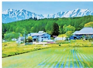
岸の裏山のスマイレ