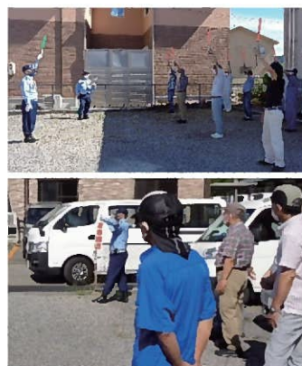
シルバー駐車場にて実技講習

駐車場内を出入りする車の簡単な案内を行うための具体的な方法や待遇など、駐車場整理に必要な知識を学び、実習も修了。