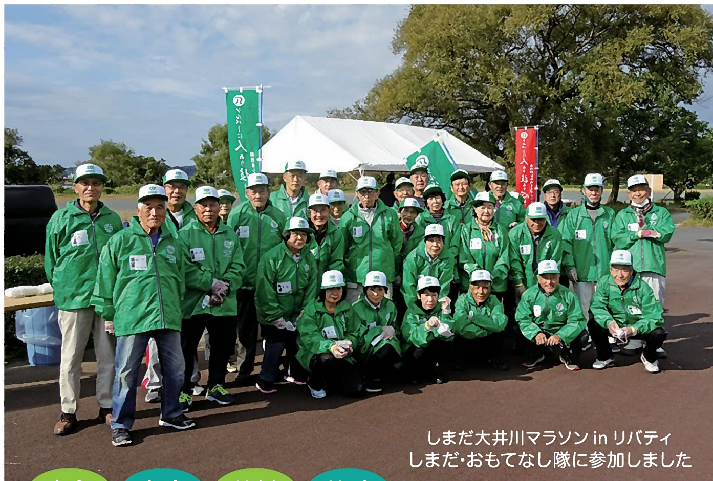
しまだ大井川マラソン in リバティ しまだ・おもてなし隊に参加しました