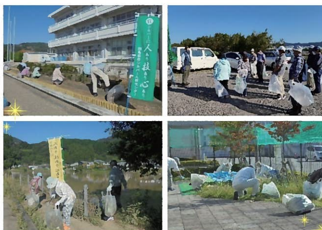
皆さん、お疲れ様でした。

今年も10月の「シルバー事業普及啓発月間」に伴い、各事務所管内にて、市内の公共施設や公園の除草・清掃作業を実施しました。