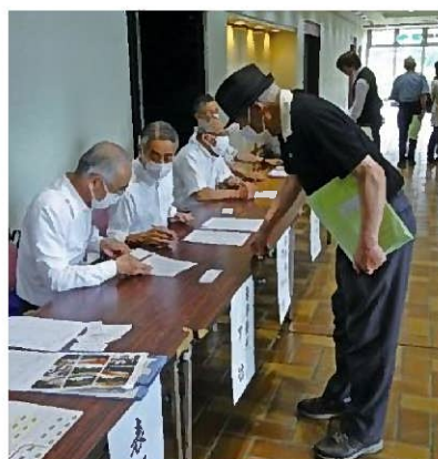
会場受付は理事さんが担当