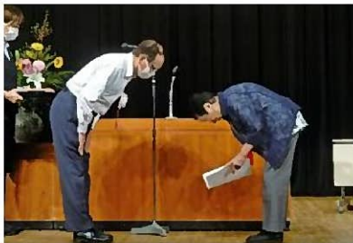
会員表彰授与の様子