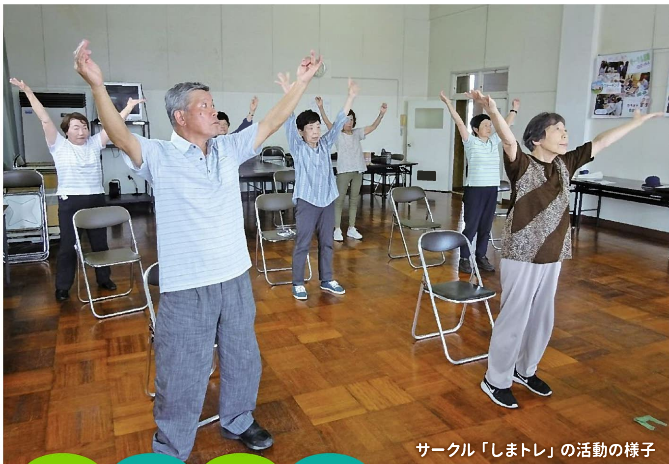
サークル「しまトレ」の活動の様子