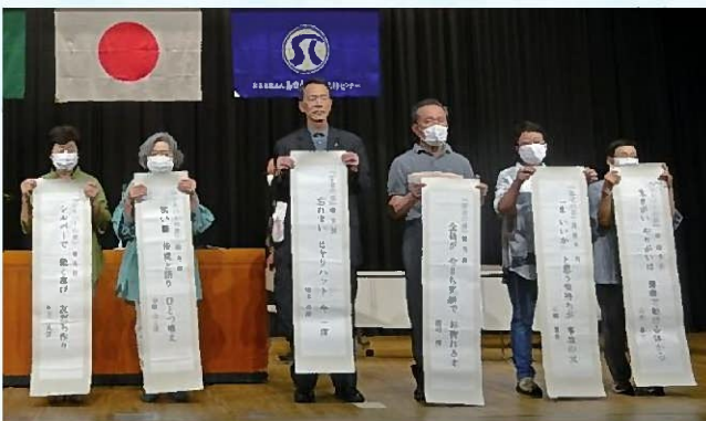
総会での表彰の様子