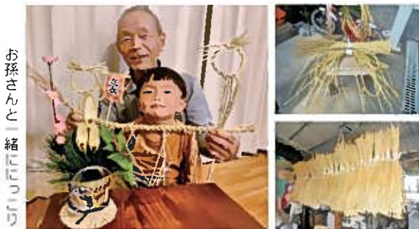
お孫さんと一緒にしめ縄づくり

昔から伝わる日本の年中行事。「新しいことを知ること大事。時代は移り変わっていくものだけれど、昔ならではの日本人の文化や思いも、大事にし続けたいなあ。」とお話してくれました。