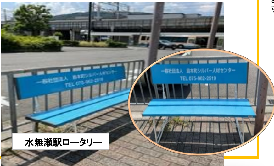
水無瀬駅ロータリー

当センターでは、啓発活動の一環として、役場前の阪急バス停留所と、阪急水無瀬駅前広場のりそな銀行前に長ベンチをそれぞれ1脚ずつ設置しました。