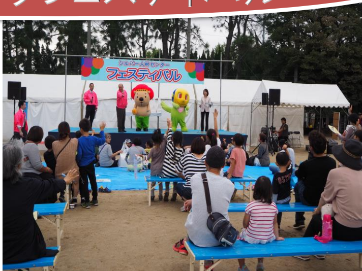
元年10月19日開催 豊中市豊島公園多目的広場にて

このフェスティバルは、シルバー人材センターの啓発活動の一環として、北摂各市町のシルバー人材センターが主催者となり、各市持ち回りで毎年開催されてきましたが、コロナ禍で2年続けて中止になっていました。今回、3年ぶりに高槻市の安満遺跡公園で開催されます。現在、各シルバー人材センターから実行委員を選出して、イベント内容の検討が行われています。