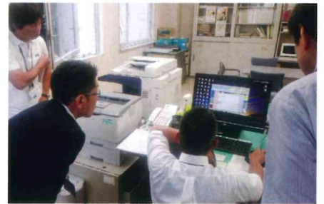
柿木事務所での事務処理の説明

隠岐の島町では、これから住民への需要調査が予定されています。かねてから念願の隠岐にシルバー人材センターの輪が広がるのも、いよいよ現実味を帯びてきました。