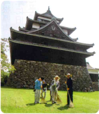
松江城周辺の清掃

います。就業会員からは、「大好きな城を見ながら、明るく楽しく就業しています。」とか、観光客から「ご苦労様です。」と声をかけられると「ますます元気が出ます。」などの声