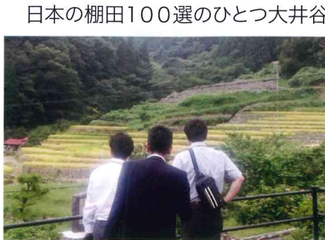
大井谷棚田の展望台より

現在島根県内では、東は安来市から西は吉賀町まで12のシルバー人材センターが活動しています。設立された時期や経緯がそれぞれ違う中で、社会福祉協議会からスタートしたセンターも少なくありません。