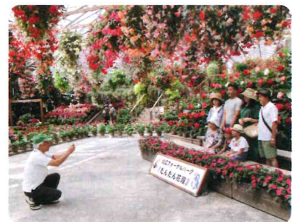
観光客と接することも

そのためには、一人でも多くの方に会員になっていただき、就業を通して充実した人生を送っていただけることを願っております。