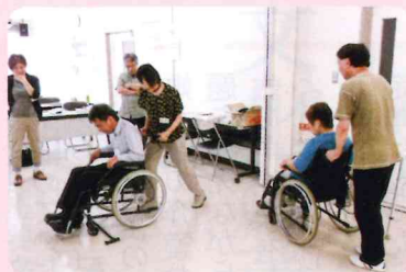
介護スタッフ育成講習

講習で印象に残ったのは、講師の体験談です。様々な利用者がいらつしゃり、それぞれに考え方や好みがあり、それらを尊重しながらより良い支援をするための対応や注意点を教えていただいたのは、とても貴重でした。 就労前の職場見学で、疑問に思うことは全て説明していただいたので、安心して就労を決めることができました。