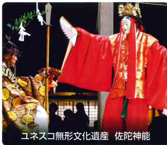
ユネスコ無形文化遺産 佐陀神能

松江市は、島根県東部に位置する県庁所在地です。平成十七年に旧松江市と旧八束郡七町村が合併し、さらに平成二十三年に旧東出雲町と合併し、現在の松江市が誕生しました。 市の中央部に中海・宍道湖を抱き、島根半島はリアス式海岸の美しい景観が続いています。古くから出雲神話の舞台である出雲地方の中心地として栄え、堀尾氏が松江城を築いて城下町として発展し、京都・奈良と並ぶ「国際文化観光都市」に指定されており、平成三十年四月に中核市への移行を目指しています。 この松江市の文化を代表する「国宝」と「ユネスコ無形文化遺産」を紹介します。