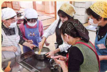
調理スタッフ育成講習

店舗スタッフ育成講習では、時代とともにルールとマナーが違ってくるかと、判断力の違いでは、「聞く」と「聴く」が力になるなどおもしろかったです。 調理スタッフ育成講習では、普段から手抜き料理をして適当でしたが、実習は計量から時間からきちんと始めて3〜4人チームで作っていました。 出来上がっていくまでの楽しさ、食べるときのうれしさ、本当に格別でした。 最後に旬の材料の料理等を教えていただき、有意義な2日間でした。