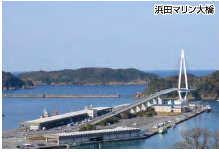
浜田マリン大橋 浜田漁港内にある水産都市浜田のシンボル。近くにある「しまねお魚センター」では「のどぐる」をはじめとする四季折々のお魚を堪能することができます。

恵まれた自然景観と天然の良港、多面的機能を持つ中山間地域、豊かな四季と温暖な気候、海・山・川に恵まれた住み良い環境にあります。 豊かな日本海は、ドンチッチ三魚（ノドグロ、アジ、カレイ）をはじめとした海の幸をもたらし、豊かな農作物とともにふるさと納税でも好評を博しています。