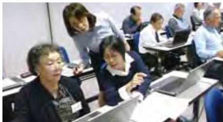
パソコン操作基礎講習の様子

いろいろな仕事・職場 で役に立つ文書作成・保 存や印刷などパソコン操 作の習得を目指し、61歳 から75歳までの15名の方 が受講されました。 パソコンに向かうのは 初めてという方もありま したが、チラシ等実習課 題を完成させたときの表 情が印象的でした。