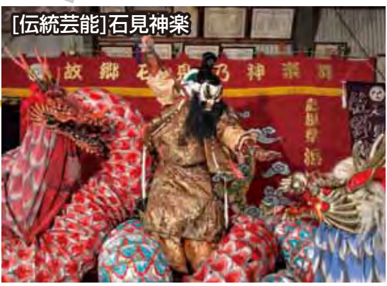
[伝統芸能]石見神楽 石見神楽は石州和紙を使った神楽面や、豪華絢爛な衣装、勇壮華麗な舞が観衆を惹きつけます。浜田市は中でも軽快な「八調子神楽」発祥の地として、50を超える神楽社中が、伝統を守り受け継ぎ発展させるため、日夜努力を積み重ねられており、荘厳な神話の世界へあなたを誘います。

浜田市は、島根県西部の中央に位置し、平成17年、旧那賀郡（金城町、旭町、弥栄村、三隅町）との合併により新浜田市が誕生しました。古くから県西部の中核都市として発展してきた浜田市は、合併により人口は県下3番目、地域も拡大し「青い海・緑の大地・人が輝き文化のかおるまち」として、まちづくりが進められています。 1619年に藩政が敷かれ、2019年に開府400年を迎えることから、浜田藩の歴史と周辺地域とのかかわりが見直されています。