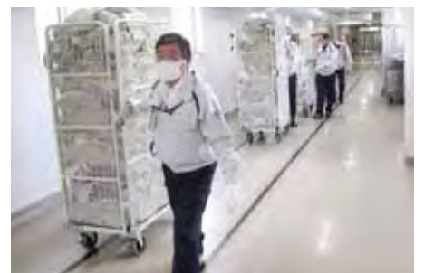
島根あさひ社会復帰促進センターでの就業