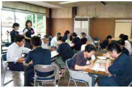
看護学生との交流事業

請負っています。また、浜田市旭町には、平成20年に「島根あさひ社会復帰促進センター」が開設され、開設当初から図書点検作業や洗濯物運搬作業を受注し、会員のローテーションにより就業しています。