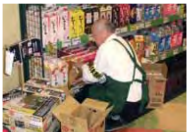
店舗スタッフ養成講習の様子

就業意欲が旺盛なこ とから、実習先から早速わ が社へ来て欲しいなどの オファーもあり、有意義 で充実した実習を体験さ れた様子でした。