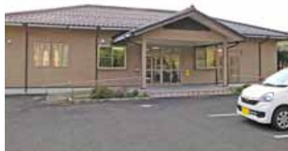
大東ゆりさわ (住宅型有料老人ホーム) 雲南市大東町中湯石82 (TEL.0854-43-8335)