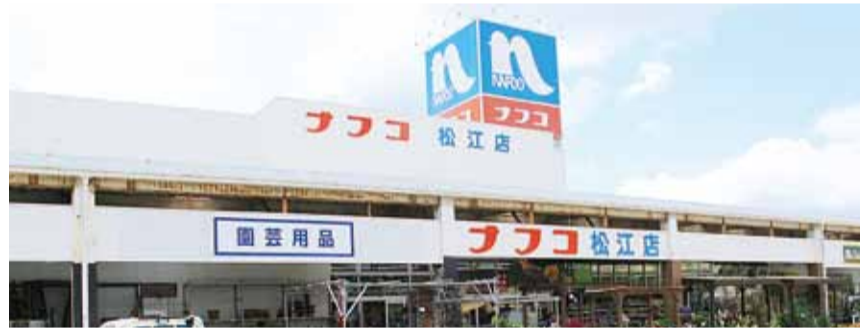
ホームプラザナフコ 松江店 島根県松江市竹矢町1850-15 (TEL.0852-38-9261)

りにできる存在であることなど、今後も多方面でシルバー派遣事業への期待を寄せたいと語っていただけました。