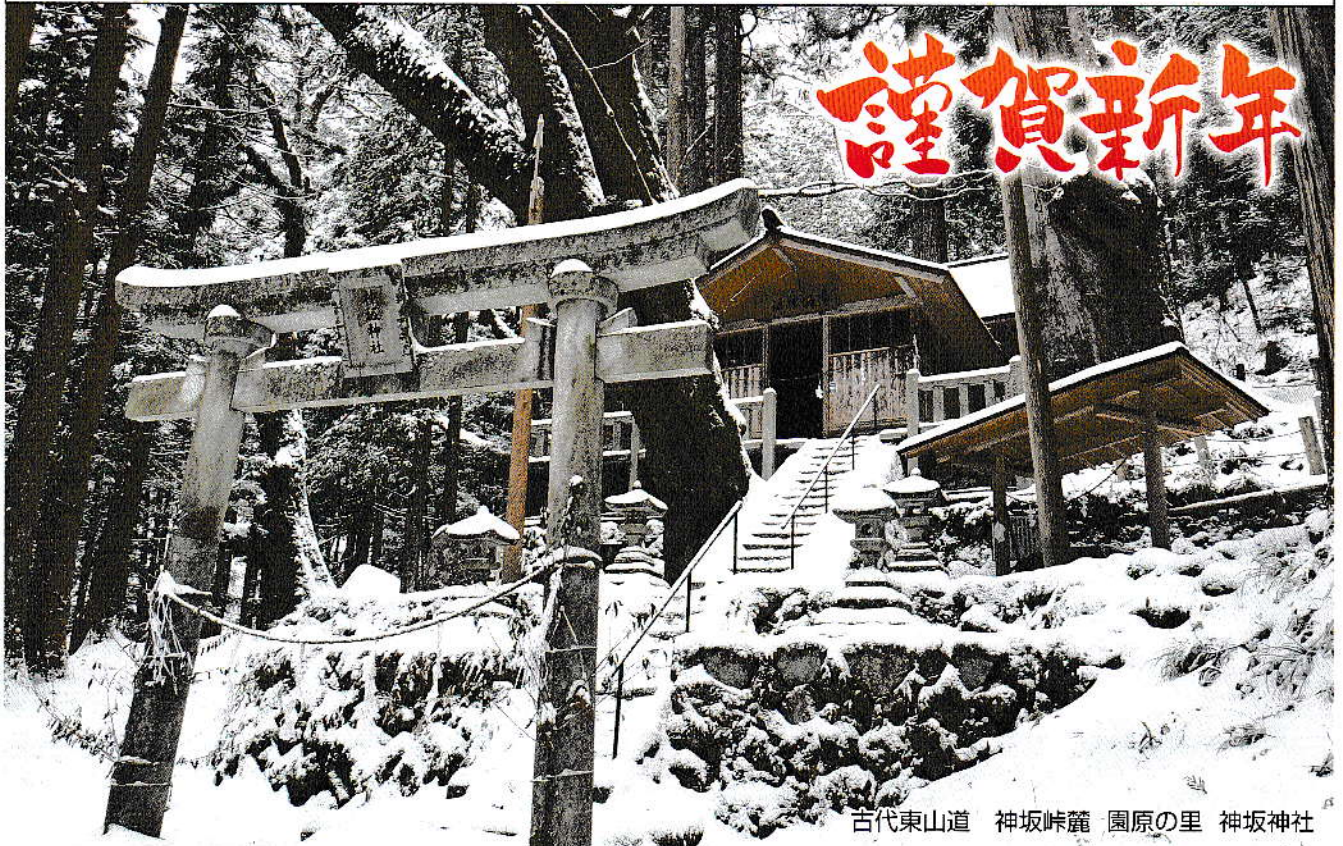
古代東山道 神坂峠麓 園原の里 神坂神社

第34号 令和7年1月10日発行 (公社)下伊那西部シルバー人材センター 〒395-0303 下伊那郡阿智村駒場487-1 電話 0265-43-2244 FAX0265-43-2290 根羽事務所 電話 0265-49-2108 FAX0265-49-2981