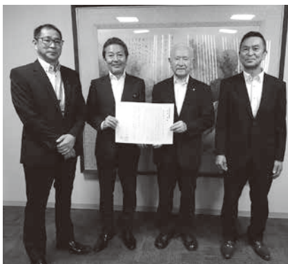
亀田市議会議長への支援要請