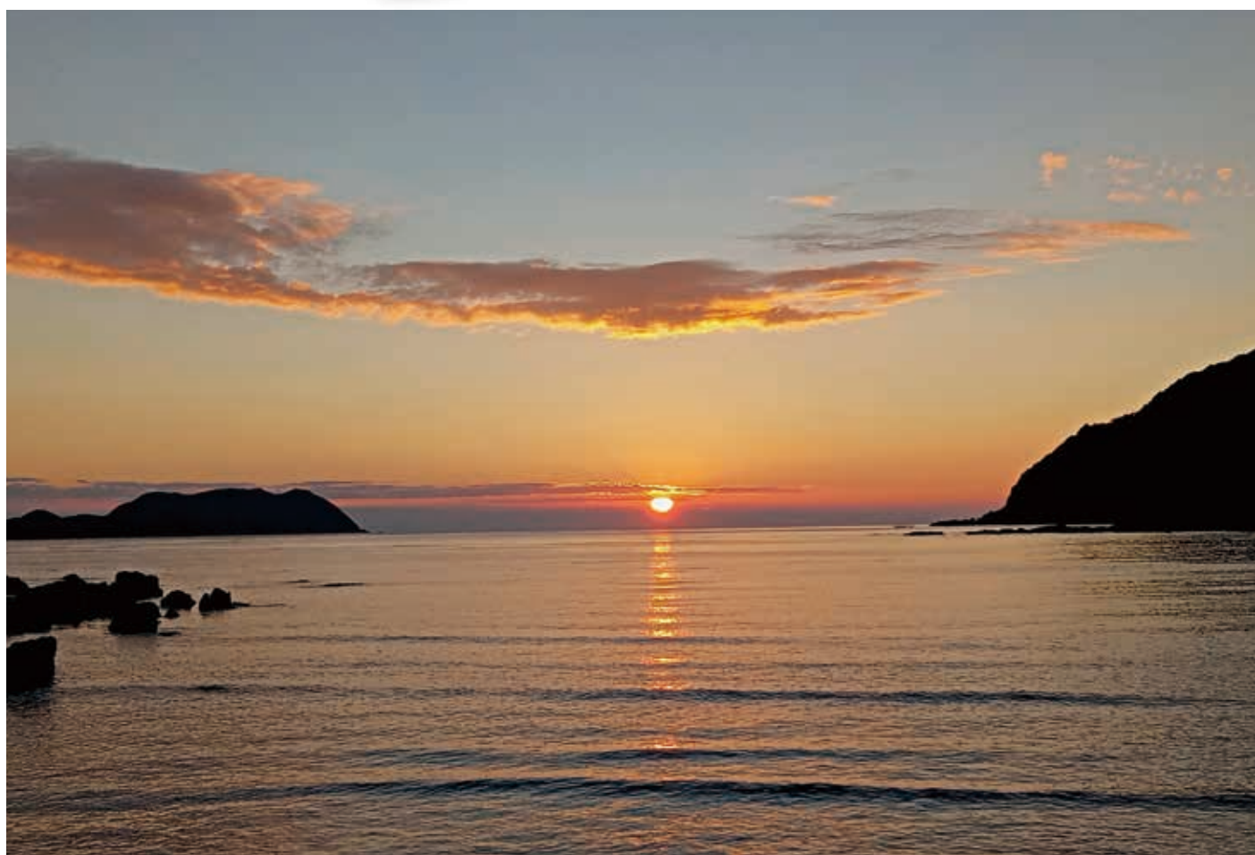
蓋井島と毘沙の鼻(本州最西端)の間の夕日