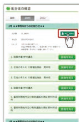
PCの配分金明細画面