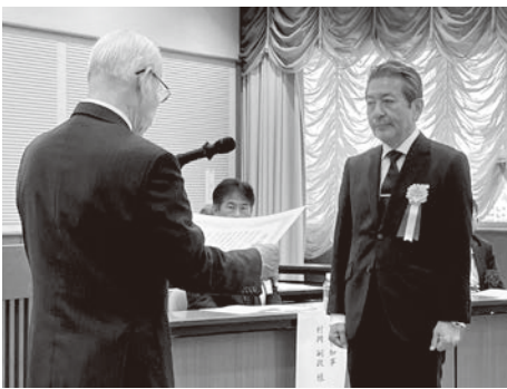
(公社)山口県シルバー人材センター連合会 会長表彰 優良センターを受賞