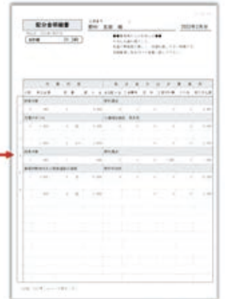
配分金明細書PDFデータ