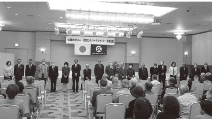
就任役員・退任役員の紹介