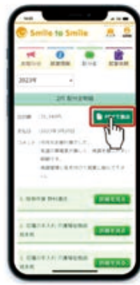
スマホの配分金明細画面

未だ「smile to smile」登録していない会員は、この機会に登録をお願いします。