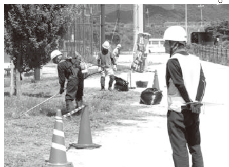
安全巡回指導(乃木浜総合公園)

今年度、第一回目〜二回目の安全巡回指導を下関本部及び豊田地域にて実施し、安全配慮についての指導を行いました。