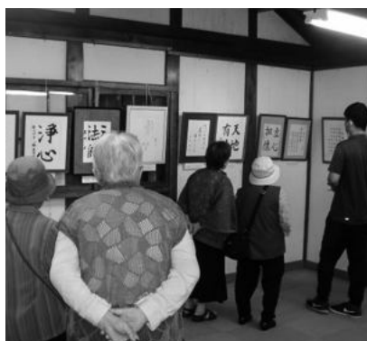
会員作品展(長府庭園三の蔵)

十月四～六日の三日間、長府庭園三の蔵にて会員さんが作成した作品を持ち寄り開催しました。川柳等の投稿をお待ちしております。