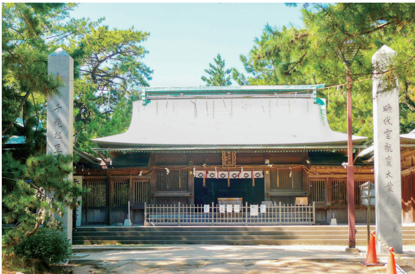
中山神社(長門国北浦総社)