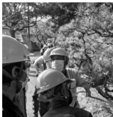
剪定講習会(勝山中学校)

令和四年度の第二回剪定講習会が十一月十日(木)に開催され、会員講師の方五名のもと、二十二名の会員と一般参加の方の六名が参加されました。今回は、下関市立勝山中学校様のご協力で校内の敷地の一角を使用させていただきました。