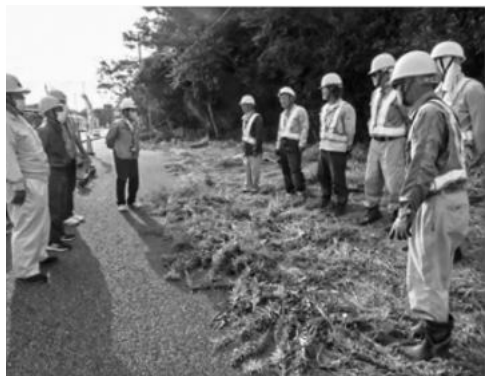
安全巡回指導(草刈作業)

今年度、第六・七回目の安全巡回指導を本部及び豊北地域にて実施し、安全対策についての指導を行いました。