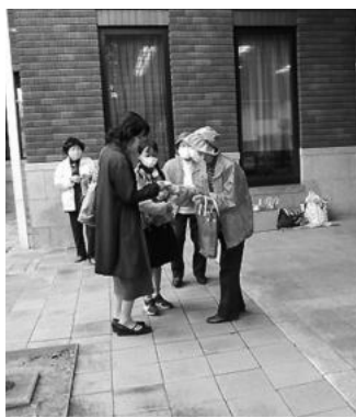
ティッシュ配り(長府東公民館)

十一月十三日(日)に長府東公民館で行った地域の文化祭で当センターのティッシュを来場者に配りました。