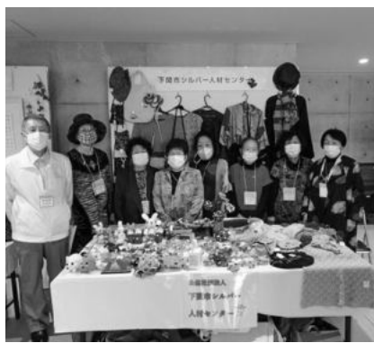
シルバーフェスティバル (下関市SCブース)

十月二十一日(金)、KDDI維新ホールにおいて開催しました。当センターからは、役員等十三名で参加しました。