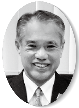
下関市議会議長 香 川 昌 則