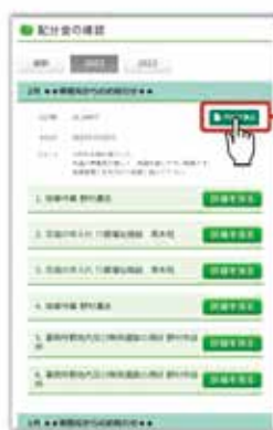
PCの配分金明細画面