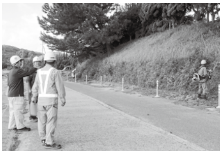
角島小学校草刈作業へ巡回指導

令和七年度も安全巡回指導を合計十回実施致しました。「安全はすべてにおいて優先する」ことを今後も心掛けましょう。