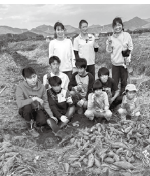
さつまいも堀体験