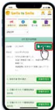
スマホの配分金明細画面

配分金明細については、「Smile to Smile」から確認できます。 未だ「Smile to Smile」登録していない会員は、この機会に登録をお願いします。