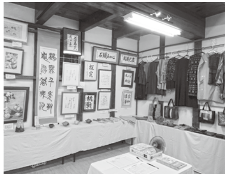
会員等の作品 長府庭園三の蔵にて

十月二日〜八日の七日間、長府庭園三の蔵において会員等が作成した作品を持ち寄り、展示会を行いました。出展者二十七名で、作品の数は、百