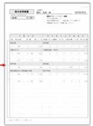
配分金明細書PDFデータ