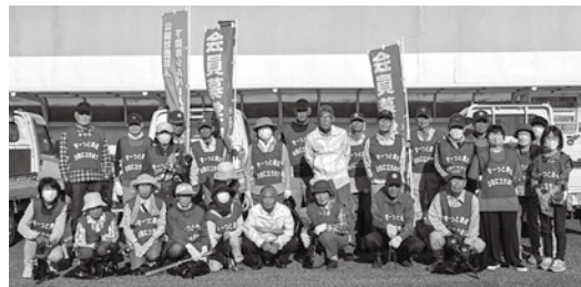
清掃奉仕活動前の記念撮影

十月十九日(日)山陽地域の会員と歩こう会(同好会)の会員と有志の方でゆめタウンから乃木浜総合公園の幹線道路のゴミ拾いを行いました。参加者は、三十七名でした。