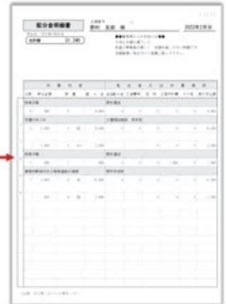
配分金明細書PDFデータ