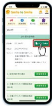
スマホの配分金明細画面

未だ「Smile to Smile」登録していない会員は、この機会に登録をお願いします。