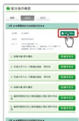
PCの配分金明細画面