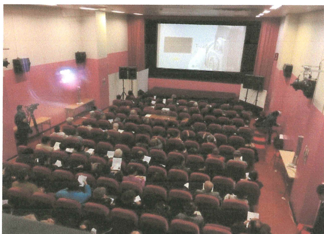
以前開催した上映会より