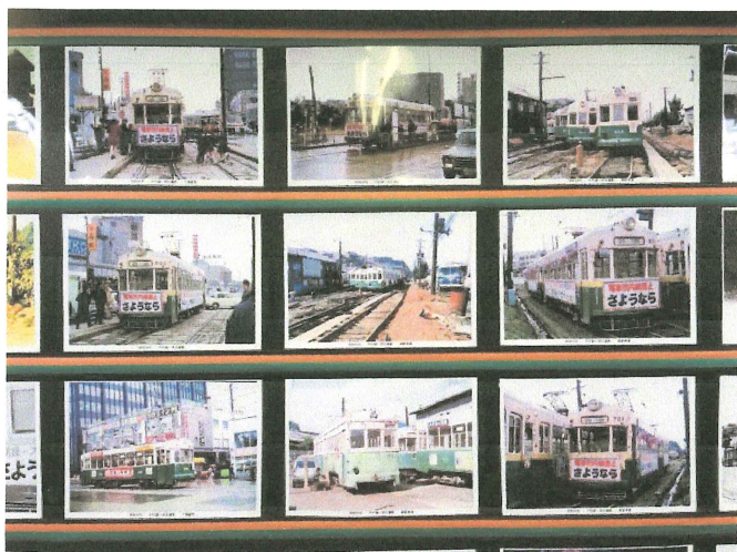
路面電車の写真