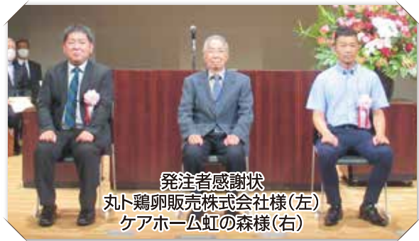
発注者感謝状 丸ト鶏卵販売株式会社様(左) ケアホーム虹の森様(右)