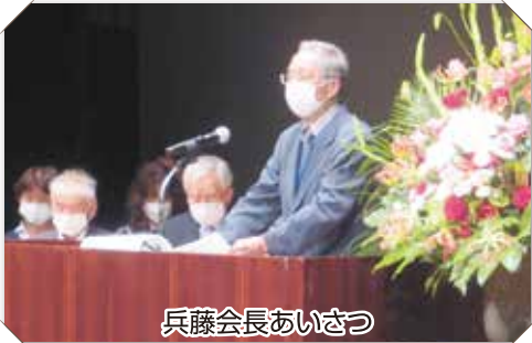
兵藤会長あいさつ

安全委員による「安全就業宣言」のなかで、「安全就業スローガン最優秀作品」を表彰させていただきました。