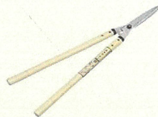
・剪定鋏 510円 (柄つき)