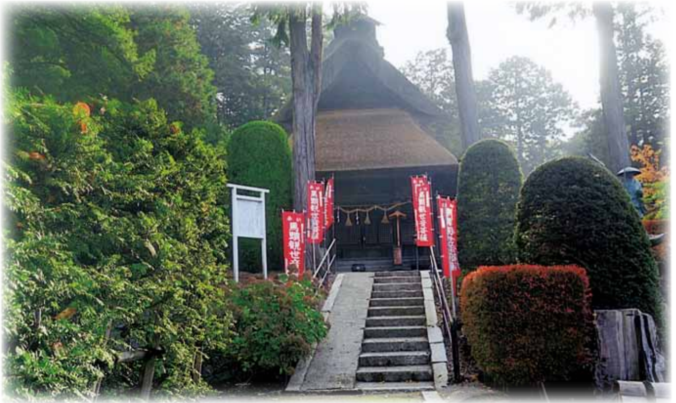
高野山真言宗 慈眼山 永福寺