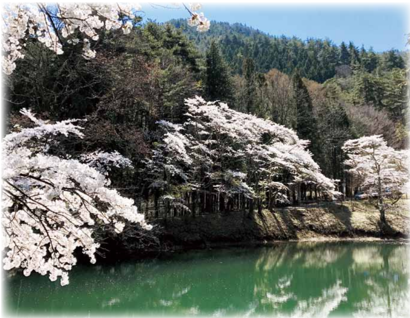
—— 平出の泉の桜 ——