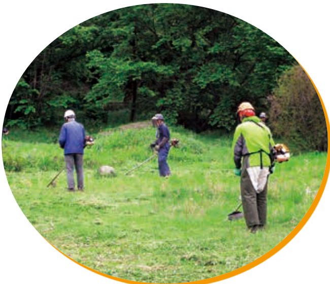
草刈り講習会 (堅石 かたせ公園)