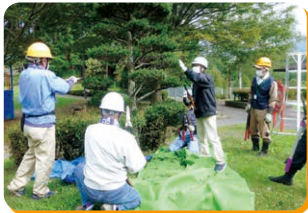
剪定講習会 (小坂田公園)