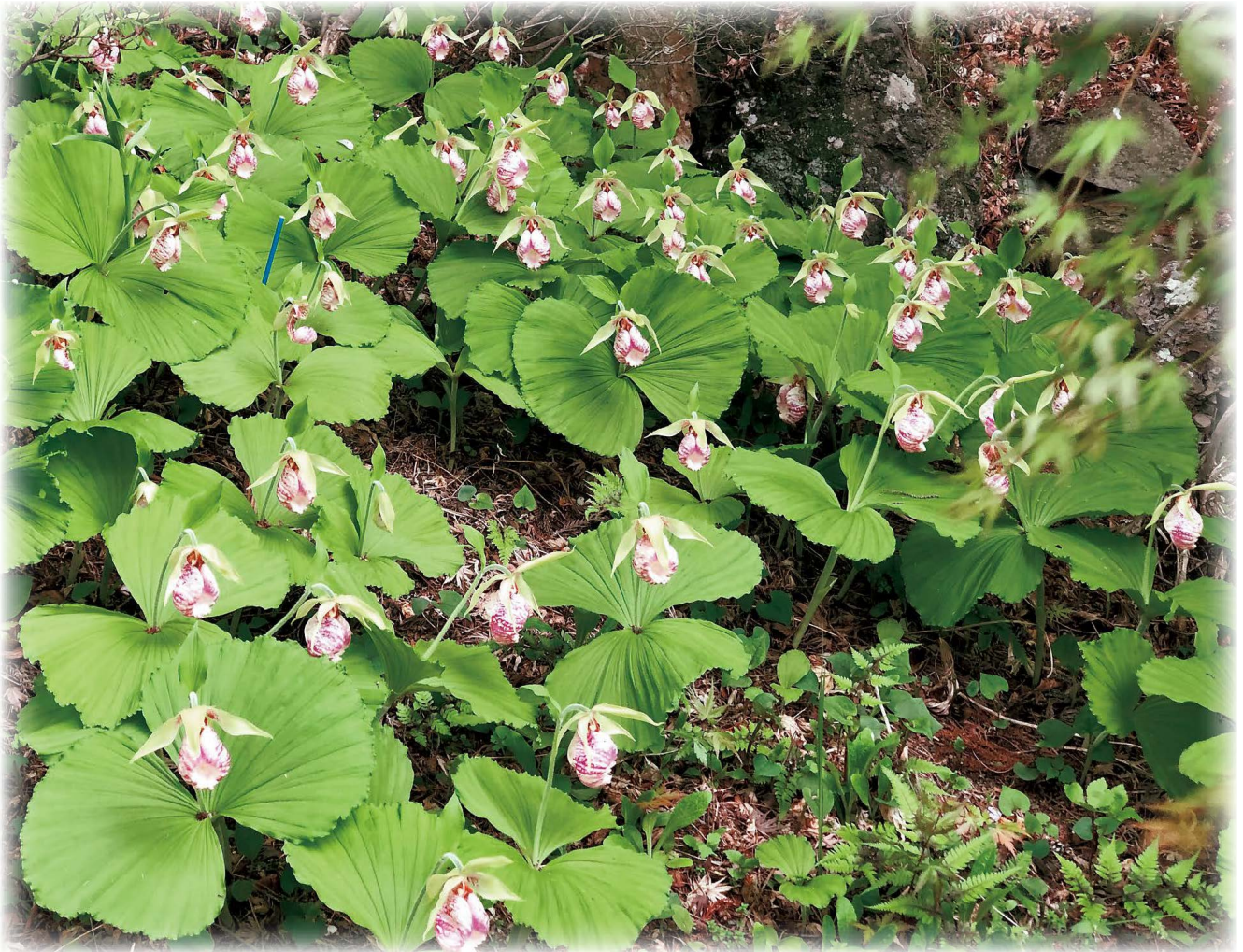
釜井庵のクマガイソウ