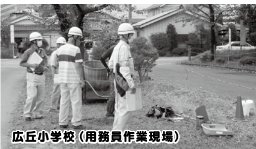
広丘小学校(用務員作業現場)