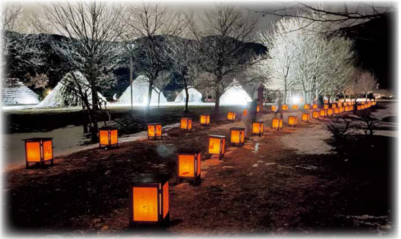
平出遺跡公園「遺跡を彩る光の旅」