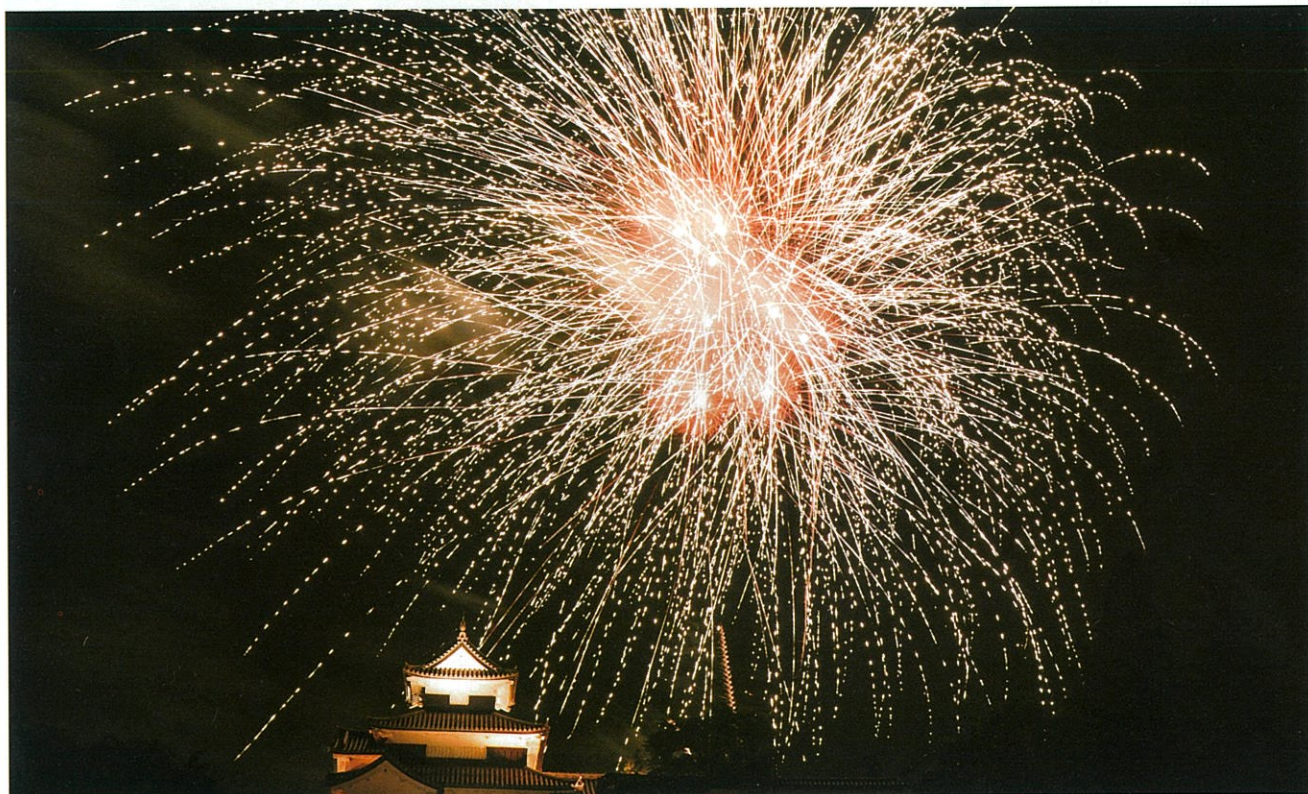
令和元年 市民納涼花火大会