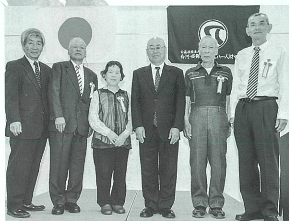
表彰された会員の方々

なお、昨年度よりポイント制度が開始されました。「新規会員の紹介」や「センター主催の講習・行事参加」などにポイントが付与され、15ポイントに達した方には総会時に記念品が贈呈されます。