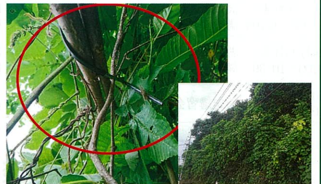
光ケーブル切断事故現場

事前に危険箇所を確認し、マーキングを行うこと。また、事故のリスクが高いと感じた場合は無理に作業を行わず、事務局と相談し、作業を回避すること。