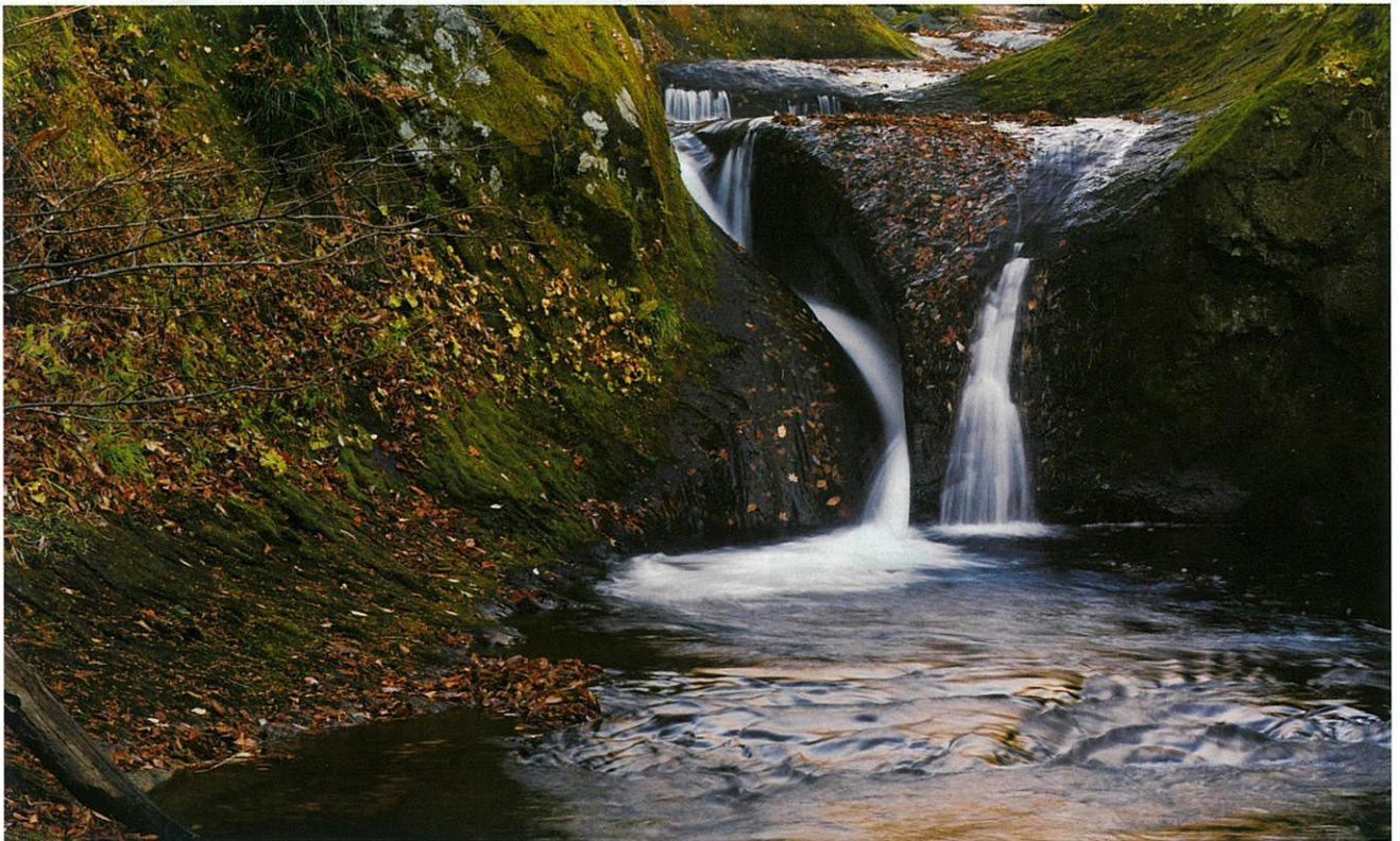
白河市大信・聖ヶ岩