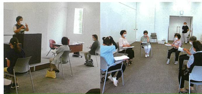
8/5(水)・6(木)・7(金) 介護予防・生活支援総合事業研修会

会場 シルバー人材センター本所会議室 内容 コロナ感染予防を徹底し、講習前の検温・問診・消毒・マスクの着用の対策を施してから開始いたしました。 襖の剥がし方からスタートし、下張りの糊の付け方張り方を教わると同時に、障子の剥がしを行い、乾くのを待って、ふすま紙の切り方張り方に入りました。最後の障子紙の張り方もそれぞれに実践し、3時間の講習会が終了しました。短