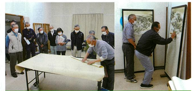
7/17(金) 障子・襖張替え講習会

会場 南湖建設機械講習所 内容 8時受付開始。8時半から刈払機の種類から始まり、作業上の注意事項までの座学講習があり、午後から小雨降る中、実技に入りました。一人ひとり刈払機の運び方からエンジンのかけ方、一定区画の刈り方の実践を行いました。各自「特別教育終了証」をもらって終了となりました。今後草刈りのメンバーとして活躍されることを大いに期待いたします。 講師 (有)南湖建設機械講習所 ・白河講習センター 受講者 会員9名