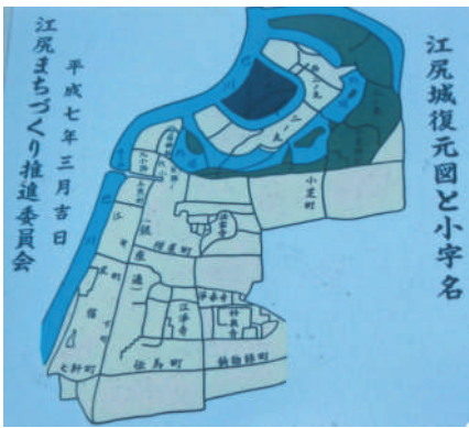
江尻城復元図と周辺