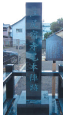
江尻宿寺尾本陣跡

袋城は、永禄13年(1570)甲斐の武田信玄が馬場美濃守に命じ、巴川の川中に半島状に突き出して築いた珍しい城で、西の徳川、東の北条に対処するため、水軍を編成している。現在の美濃輪は袋城の外曲輪であり馬場美濃