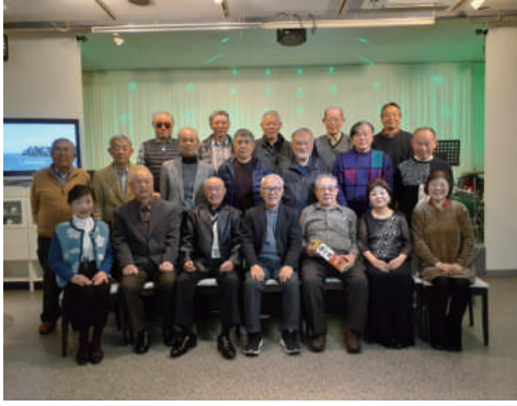
参加をお待ちしています！

今後、ますますの発展のために会員を募集しておりますので、参加をお願いいたします。