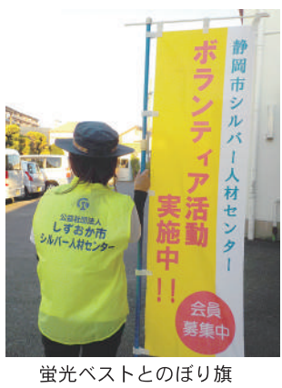
蛍光ベストとのぼり旗

交通安全講習会 9月21日に西事務所にて静岡中央警察署と静岡県交通安全協会静岡中央地区支部による交通安全講習会を開催しました。 歩行環境シミュレーターを使い、交通量の多い道路横断や雨天時、夕暮れ時から夜間にかけて