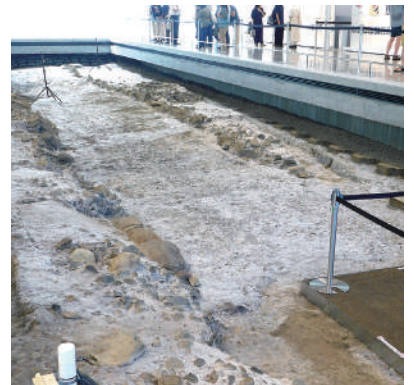
発掘調査で見つかった道と石垣の遺構

建物は4階建て、一部1階となっていて延床面積約4千9百㎡、博物館の建物は防虫など資料保存の設備が取り入れられている。1階は無料エリアとなっていて、いつでも静岡の歴史を身近に感じることができる。建設前に発掘調査で発見された「戦国時代末期の道と石垣の遺構」