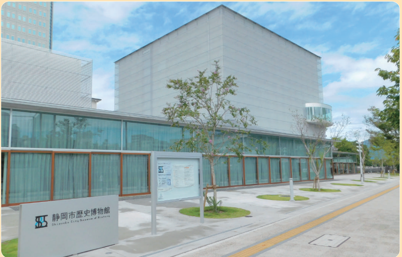
静岡市歴史博物館（関連記事11頁）