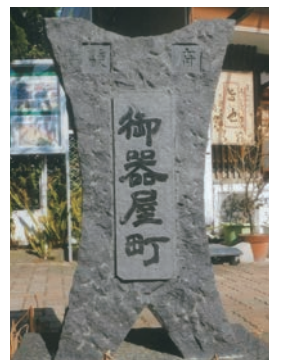
浅間神社東側道路端の御器屋町碑

一部町名を挙げると、呉服町、人宿町、上石町、茶町、桶屋町、大鋸町、車町、研屋町、馬場町、宮ヶ崎町、鋳物師町、寺町、大工町、紺屋町ほか省略。