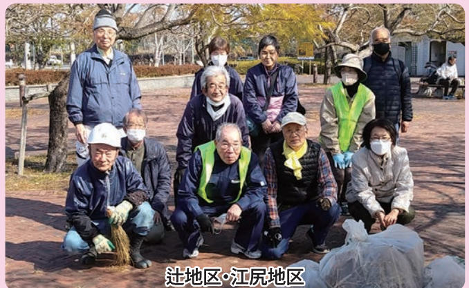
辻地区・江尻地区