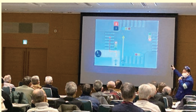
キャリアアップ研修の様子

会員の皆様においては、就業中、就業途上の事故には十分気をつけていただきますよう、宜しくお願いいたします。