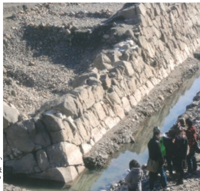
発掘された駿府城大天守閣の石垣

天正14年(1586) 45歳の時、秀吉の妹朝日姫を継室に迎える。同年浜松城から駿府に本城を移し、駿府城の修築を行い完成させる。しかし天正18年(1590)