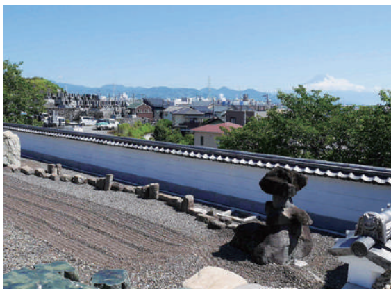
萬象寺からの眺め

清水区駒越西に在ります臨済宗妙心寺派寺院萬象寺の草刈り作業の現場にお邪魔しました。遠くに富士山、近くに駿河湾が奇麗に見えました。 若色住職にお話を伺いました。ご住職はとても柔和な方で、京都出身の先代ご住職のお庭造り、清掃のお心を受け継がれていらつしやると伺い、お庭だけでなく、お墓周りも手入れが行き届いていることを拝見し、檀家の皆様も気持ちよくお参りされていることと思いました。