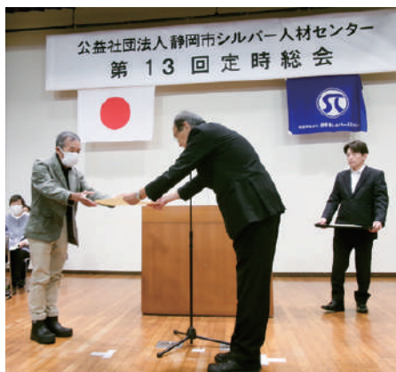
表彰状授与される大橋会員

事会において、理事長、副理事長及び常務理事が選任されました。任期は、第15回定時総会最終時までです。