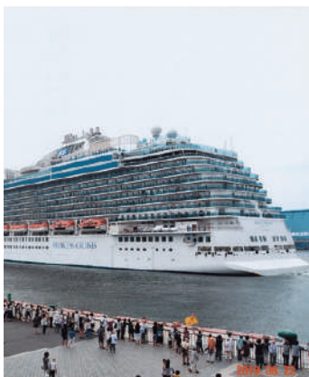
豪華客船ダイヤモンド・プリンセス号の出航

いつて、港内用の船(ダルマ船)で約180トンの荷物の積み下ろしを沖に停泊する本船とを往復し行われていたが、大量の荷物や天候には対応できなかった。港湾の発展には、大型船が横付けできる岸壁が必要であり、日の出埠頭が築造された。同時に荷物を保管する上屋や道路網の整備が行われている。