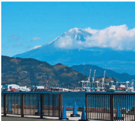
日の出埠頭からコンテナ基地の ガントリークレーンが見える

第二次修築事業は、1921 (1938 (大正10年) 昭和13年) 当時の船への荷役作業は沖積みと