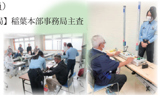
R5交通安全教室の様子