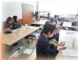
R5手洗い講習会の様子