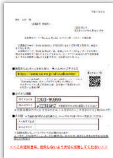
「ログインID・パスワード通知書」