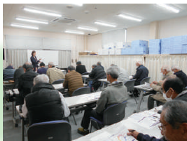
R5 接遇講習会の様子