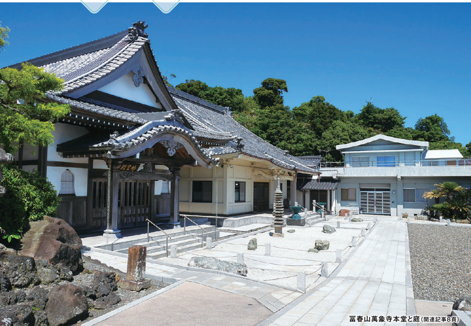
富春山萬象寺本堂と庭(関連記事8頁)

センター会員数 (R6.7月末) ■ 男…1,600名 女…977名 計…2,577名