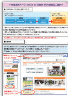
「ご利用開始のご案内」