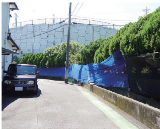
飛び石対策用ネット

有無等を仲間にも必ず連絡し、お客様とも密に打ち合わせを行い、優先事項を見極めることが重要。また、作業中は仲間の体調、気温、作業の進み具合を見ながら、休憩、水分補給を心掛けています」と、リーダーの気概を感じました。