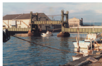
清水港線巴川河口にかかる 可動橋 (昭和55年) 廃線昭和59年

を主とした生活は、海や川との関わりも多くあったと思われ、居住近辺で大きな貝塚や魚骨などが発掘されている。この時代の舟は小さいが、川岸などでの使用には十分だったと思われる。