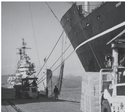
日の出岸壁の荷役作業 前方に米巡洋艦トレドが入港 (昭和31年)

を主とした生活は、海や川との関わりも多くあったと思われ、居住近辺で大きな貝塚や魚骨などが発掘されている。この時代の舟は小さいが、川岸などでの使用には十分だったと思われる。