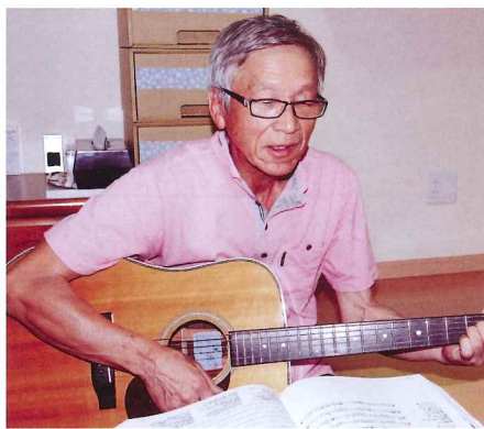
ヤイリ製のフォークギター

私がギターに興味をもったのは、高校時代。『ザ・タイガース』、『ワイルドワンズ』などのグループサウンドやフォークソングが真つ盛りの頃、地元で三味線を弾く先輩といっしょに自己流でエレキベースを弾き始めたのが始まりです。今思えば、音楽知識も技術もなくてうまく曲も弾けないながらも、とても楽しかつ