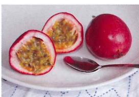
甘酸っぱいフルーツ