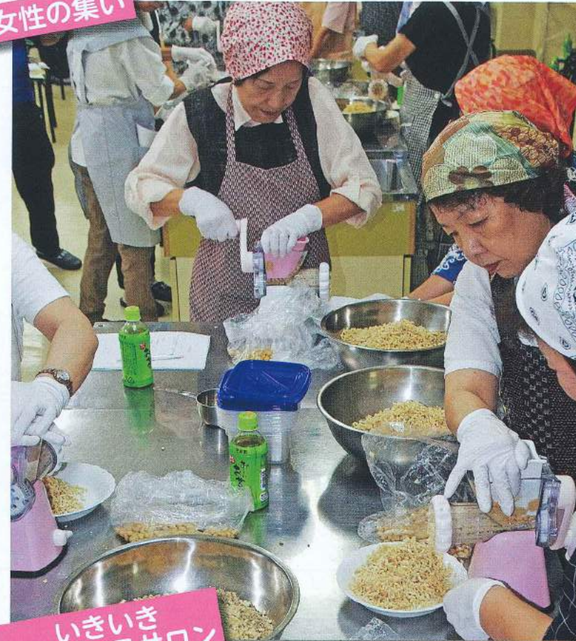
いきいき レディースサロン