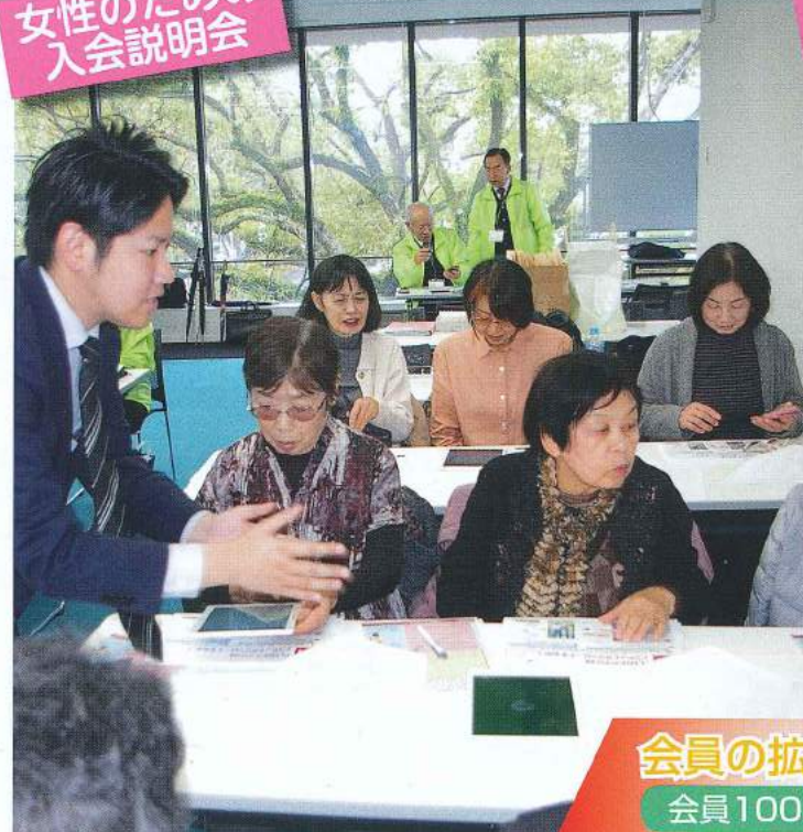
女性のための 入会説明会