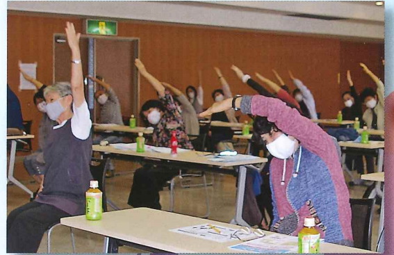
生き・生き・息 アップ! アップ!