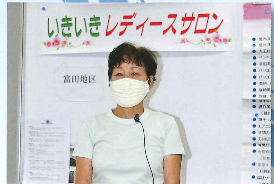
“免疫力を高める” お話でした