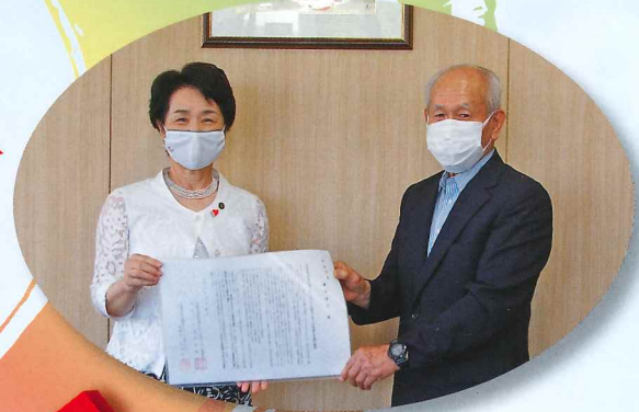
“会員の声”を届けました