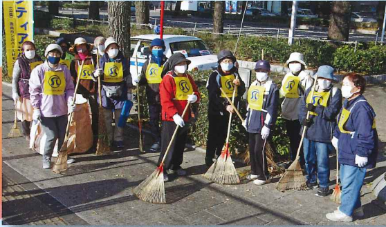
道も、心も、きれいに!