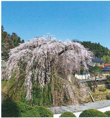
鹿野 弾正 (だんじょう) 糸桜