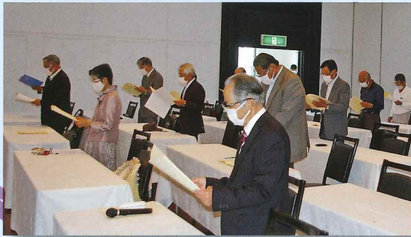
“ソーシャルディスタンス”で総会開催