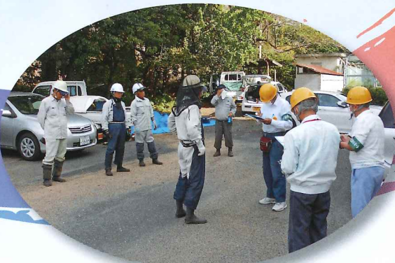
就業の安全を確認しました