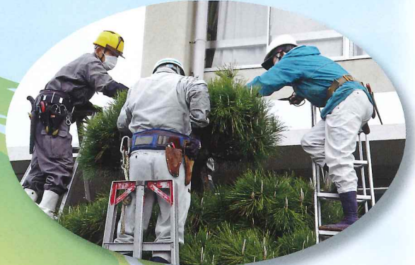
きれいに剪定できました