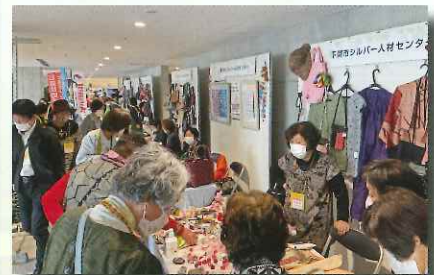
10月・県シルバーフェスティバルに参加