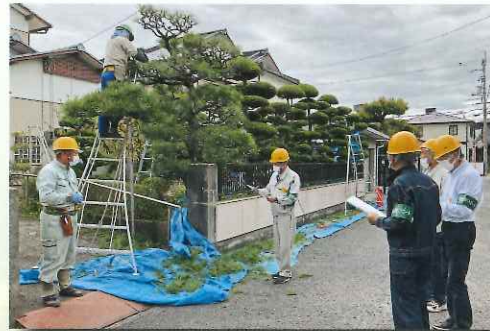
9月・安全パトロールで就業の安全を確認