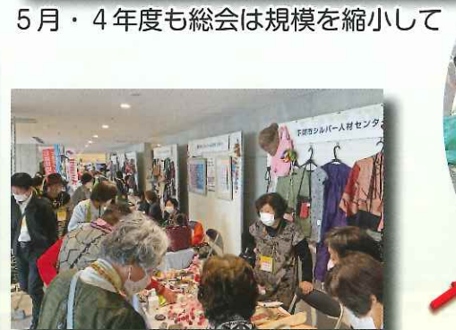
5月・4年度も総会は規模を縮小して