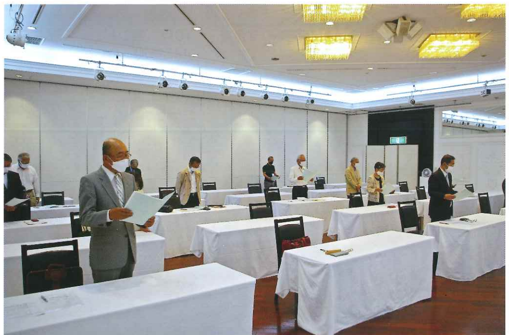
昨年の総会。3年続けて規模を縮小して開催しました。