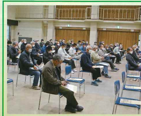
全員で「安全宣言」を唱和しました

会員約70人が参加して、3年ぶりの安全推進大会が2月24日、周南地域地場産業振興センターで開催されました。大会では最初に周南警察署より高齢者の交通事故防止や道路交通法の改正により4月から努力義務となる自転車でのヘルメット着用等について講話をいただきました。続けてセンター業務での事故事例や安全パトロールの結果等について報告があり、最後に、「安全大会宣言」を全員で唱和して、事故0への誓いを新たにしました。