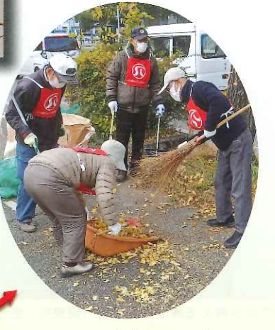
11月～3月・各地区でボランティア清掃・剪定活動