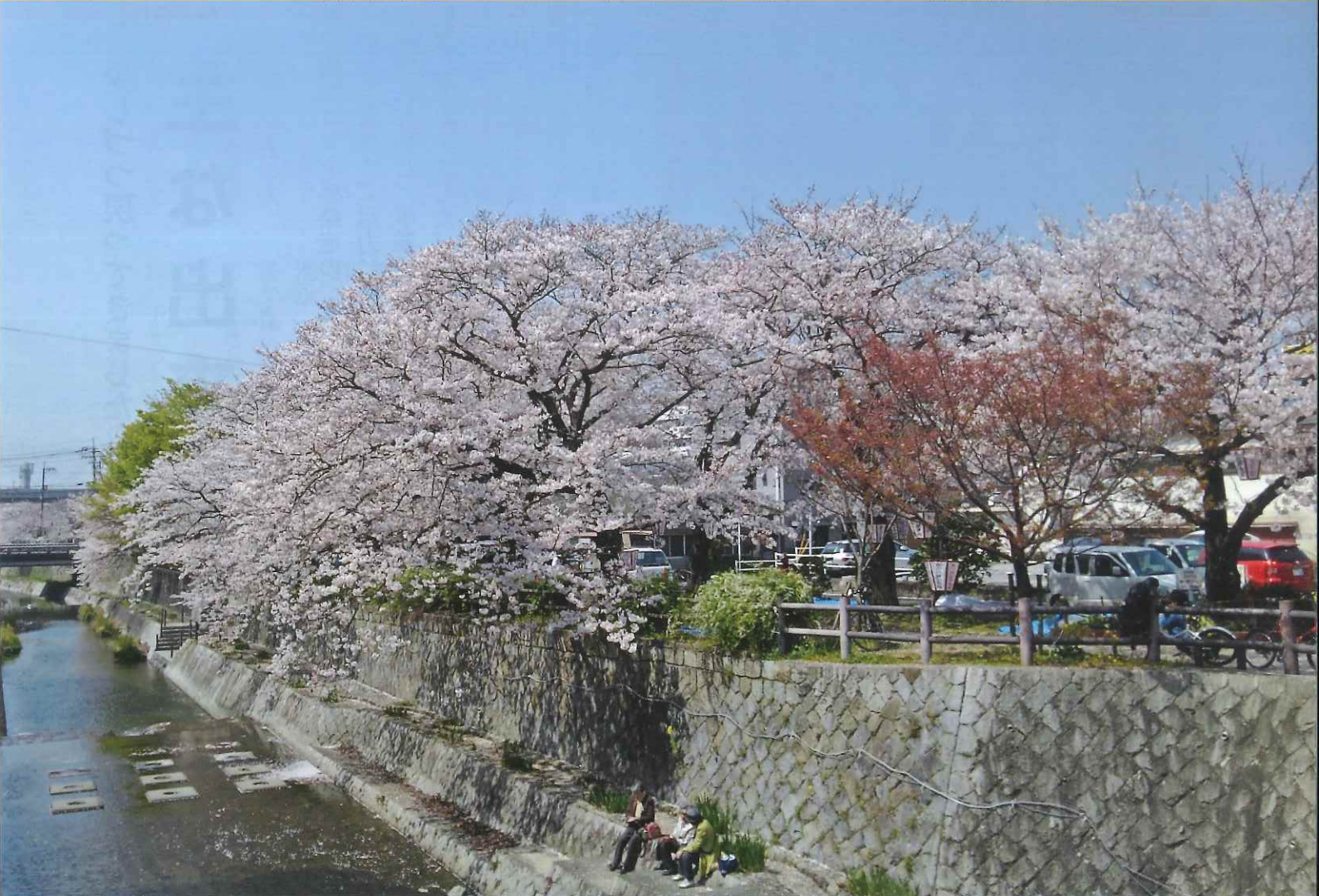
川面に桜が映える東川緑地公園 (河東町・令和4年4月)

発行／(公社)周南市シルバー人材センター 山口県周南市桜木三丁目1-3 ☎0834-25-6262 編集／広報等編集委員会 印刷／大村印刷