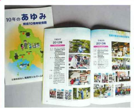
10周年記念誌はこんなカンジでした

今年は今センター統合発足20周年。センターでは現在、この20年間の取り組みや会員活動を紹介する記念誌の編集作業中で、これに掲載する写真を探しています。 職場やイベント、同好会、親睦旅行など、会員の皆さんが個人でお持ちの写真がありましたらぜひご提供ください。データかプリント写真で、写真は後日お返しします。 まずは、編集の都合上、8月末までに事務局にご連絡を。