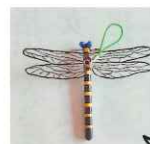
草刈・ キャンプに