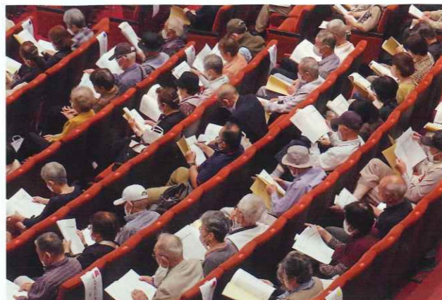
206人の方に来場いただきました

定時総会の開催、まことに おめでとうございます。 統合20周年とのことですが、当初からの会員の方も多くいらっしゃると思います。 いろいろご苦労もあつたと思いますが、そうした方々のご尽力のおかげで今日の周南市があることに心より感謝を申し上げます。 人生百年時代にあつて、生涯現役を目指しておられるとのことですが、会員の皆様の平均年齢は75歳とお聞きしました。 まだまだ先は長いですが、活躍いただく時間は十分です。健康に気をつけて、これまで培った知識と経験を活かし、引き続き現役プレーヤーとして地域の発展にご尽力いただきたいと思っております。 皆様のご健勝とご活躍を祈念し、今後とも市政へのご協力をお願いいたします。