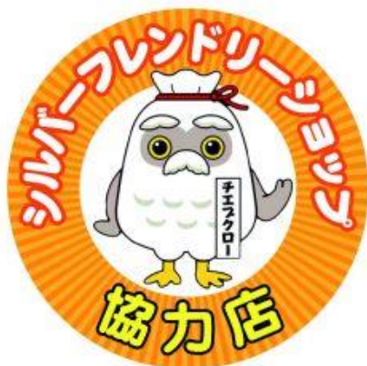
協力店ステッカー