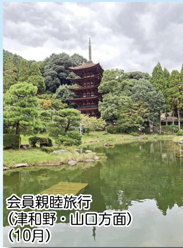
会員親睦旅行 (津和野・山口方面) (10月)

事故発生状況や安全パトロールの実施状況について報告が行われた後、ALSOK株式会社の職員による心肺蘇生法およびAEDの使用方法に関する講義が実施されました。参加者全員で「安全宣言」を唱和し、事故ゼロへの誓いを新たにしました。