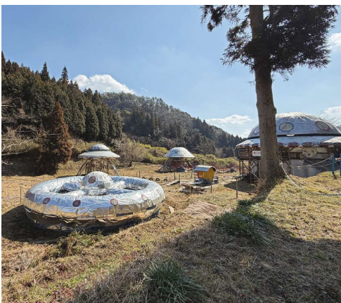
周南市須々万奥 山中に突然現われた宇宙の駅

徳山出身の明治の軍人、政治家で台湾総督や陸軍、文部、内務大臣を務めた児玉源太郎が祭神。「児玉文庫」を開設するなど故郷のために尽くした。同神社境内には幕末殉難七士の碑もある。