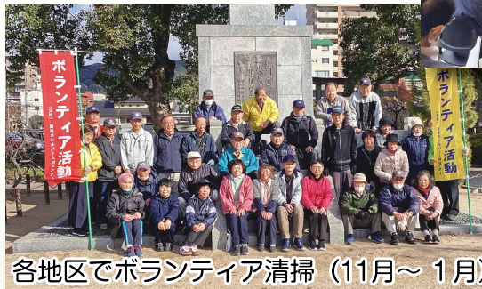
各地区でボランティア清掃 (11月～1月)