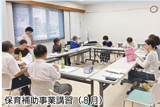
保育補助事業講習 (8月)