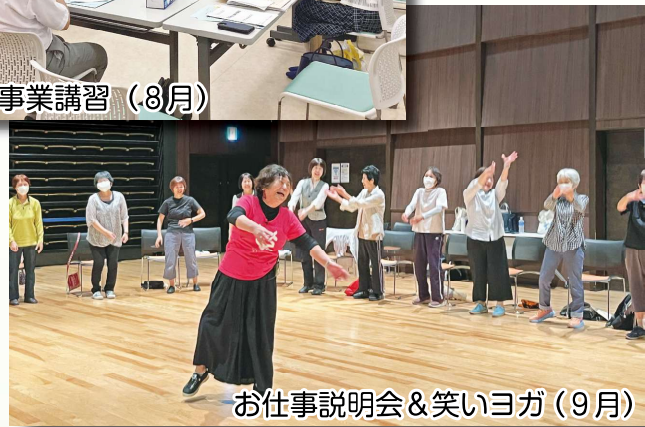
お仕事説明会&笑いヨガ (9月)