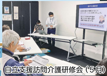
自立支援訪問介護研修会 (5月)