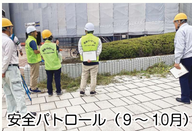
安全パトロール (9~10月)