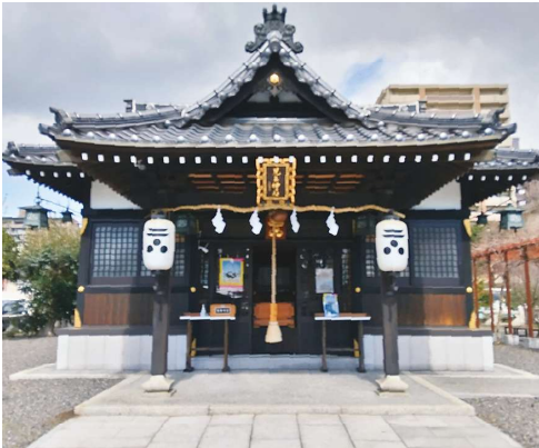
児玉神社社務所開設