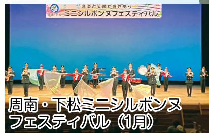
周南・下松ミニシルボンヌ フェスティバル (1月)