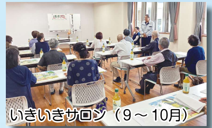
いきいきサロン (9～10月)