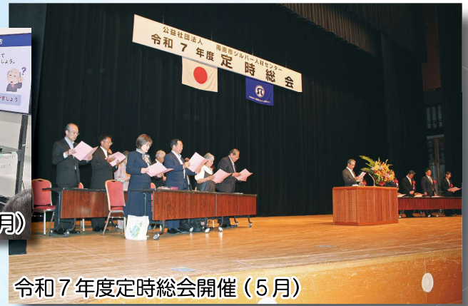
令和7年度定時総会開催 (5月)