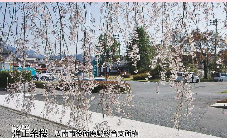
たんじょう 弾正糸桜 周南市役所鹿野総合支所横