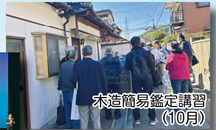
木造簡易鑑定講習 (10月)