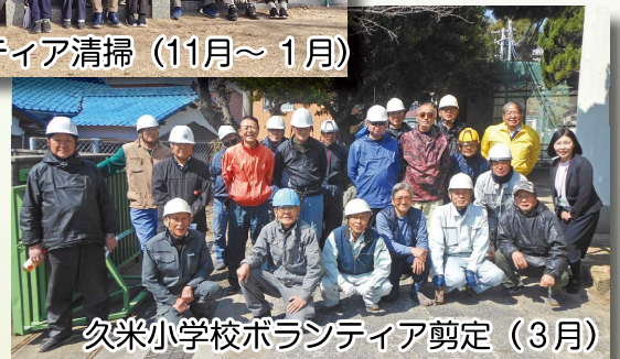
欠米小学校ボランティア剪定 (3月)