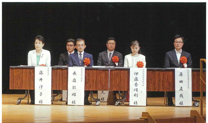
ご出席いただいた来賓の皆様