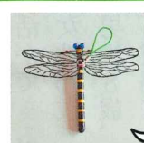
草刈・キャンプに