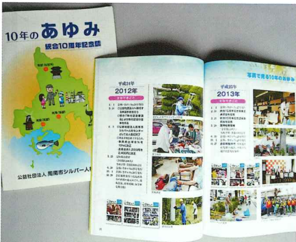
10周年記念誌はこんなカンジでした