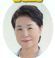
藤井律子 周南市長