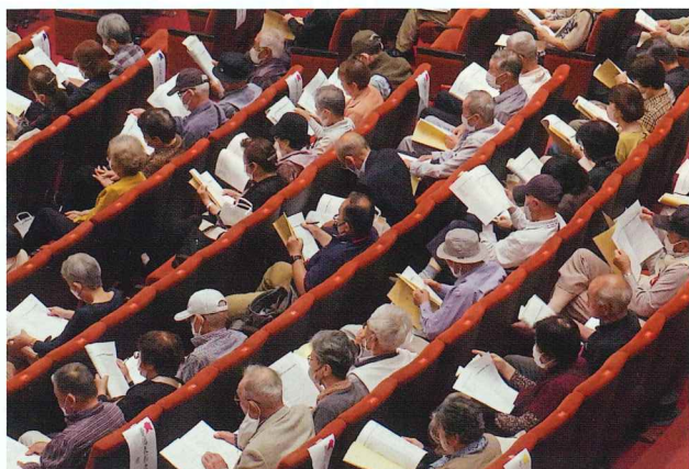
206人の方に来場いただきました