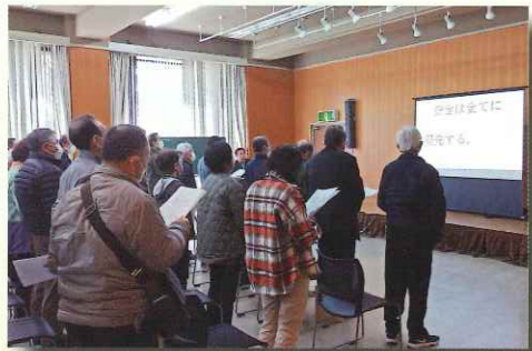
救急対応の動画はパソコンやスマホでも、「応急手当WEB講習」で検索

続いてセンター業務での最近の事故状況等の報告があり、最後に全員で「安全宣言」を唱和して事故0への誓いを新たにしました。