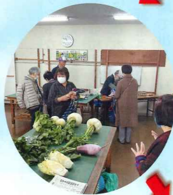
12月 エコ朝市は大繁盛 (P 4参照)