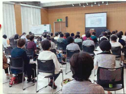
6～11月 女性の集い・いきいきレディースサロンが各地で開催されました