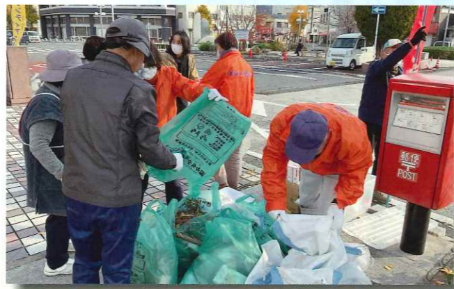
11～2月 ボランティア清掃で街は装いも新たに

令和5年度は、ようやくコロナ禍を脱し、業務は概ね順調に回復するとともに、4年ぶりに会員一堂に会しての総会や会員親睦旅行が開催されるなど、多くの皆さんの参加により、行事も再び活性化してきました。またコロナによる働き方の変化やインボイス制度への対応など、センターにとっても新たなスタートの年となりました。P 6に今年度の主な行事予定を掲載しています。引き続き会員同士の交流と絆が一層深まるよう、多数のご参加をお願いいたします。