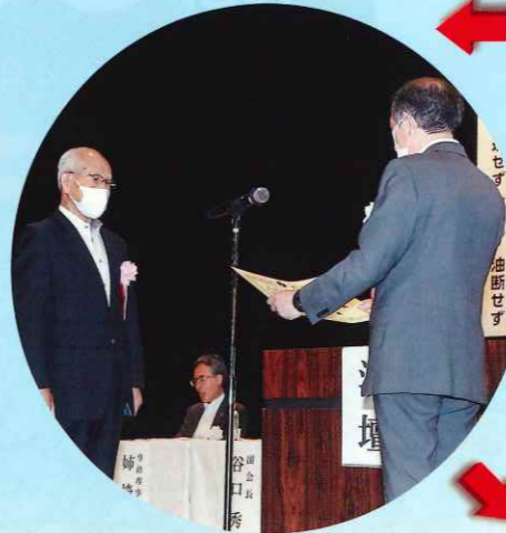
6月 安全優良団体として全国表彰されました