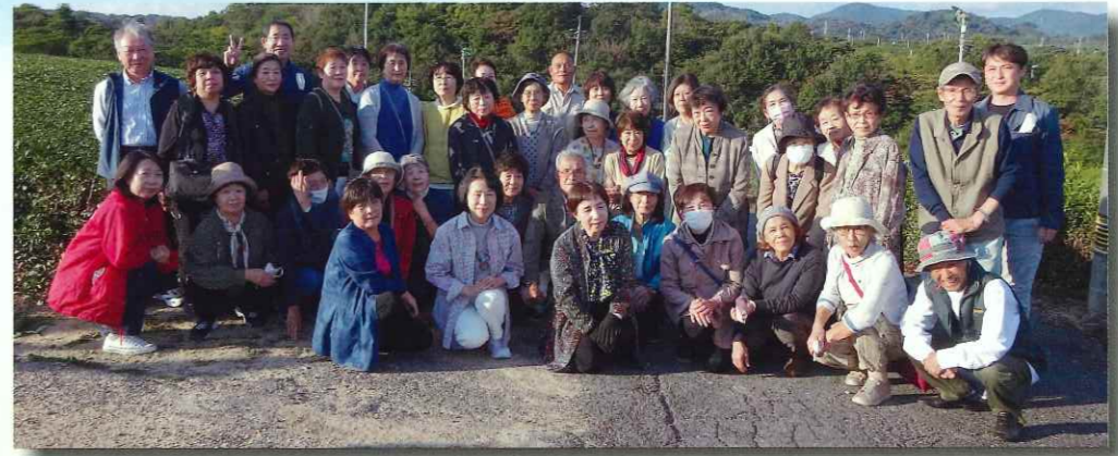
10月 4年ぶりの会員親睦旅行は長門・宇部方面へ