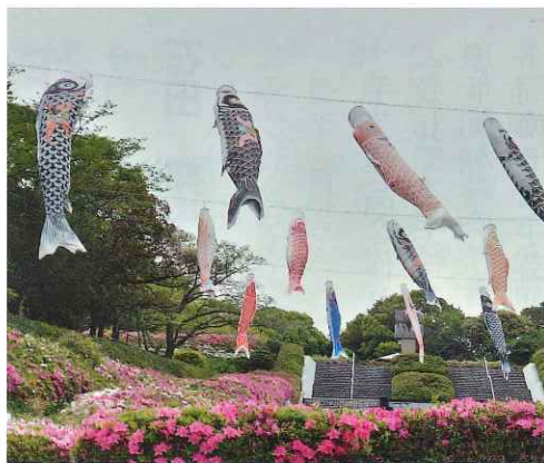
永源山こいのぼり