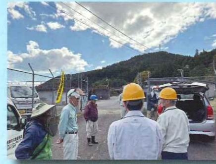
9～11月 4地区で安全パトロール