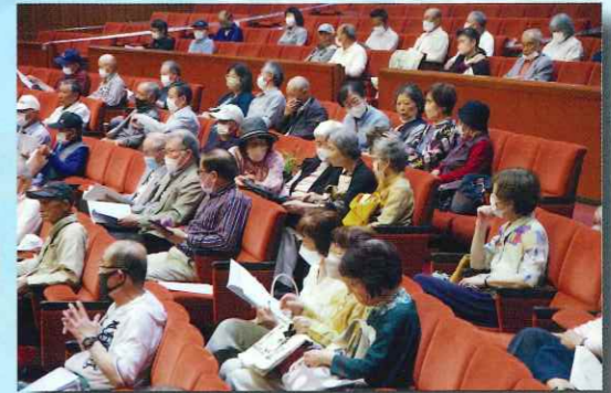
6月 定時総会は4年ぶりに通常開催ができました