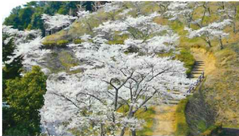
春の鹿野天神山桜並木