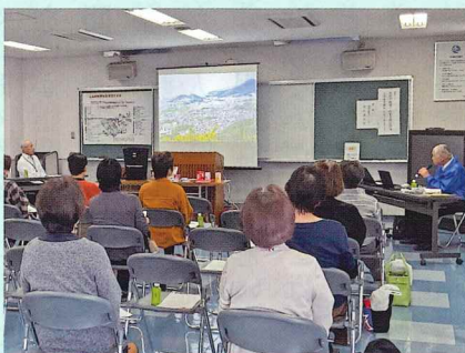
いざという時、慌てないように