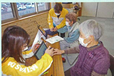
数値が出るまでちょっとドキドキ

今回のテーマはベジチェック（野菜摂取量チェック）や血管年齢チェックによる健康診断。年齢より若いですよ、との判定に一安心の笑顔が……。今回のもう一つのテーマは地域班長さんや未就業の会員も交えての懇談会。日ごろ思っていることや感じていることに話の花が咲き、地域の関わりはますます深くなったようです。