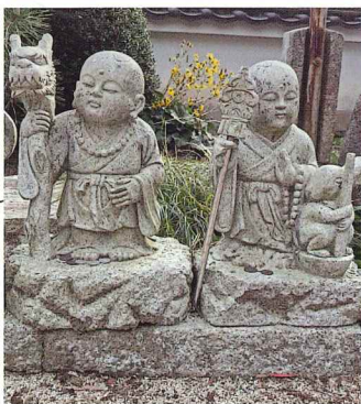
卯から辰へ (湯野・楞嚴寺)