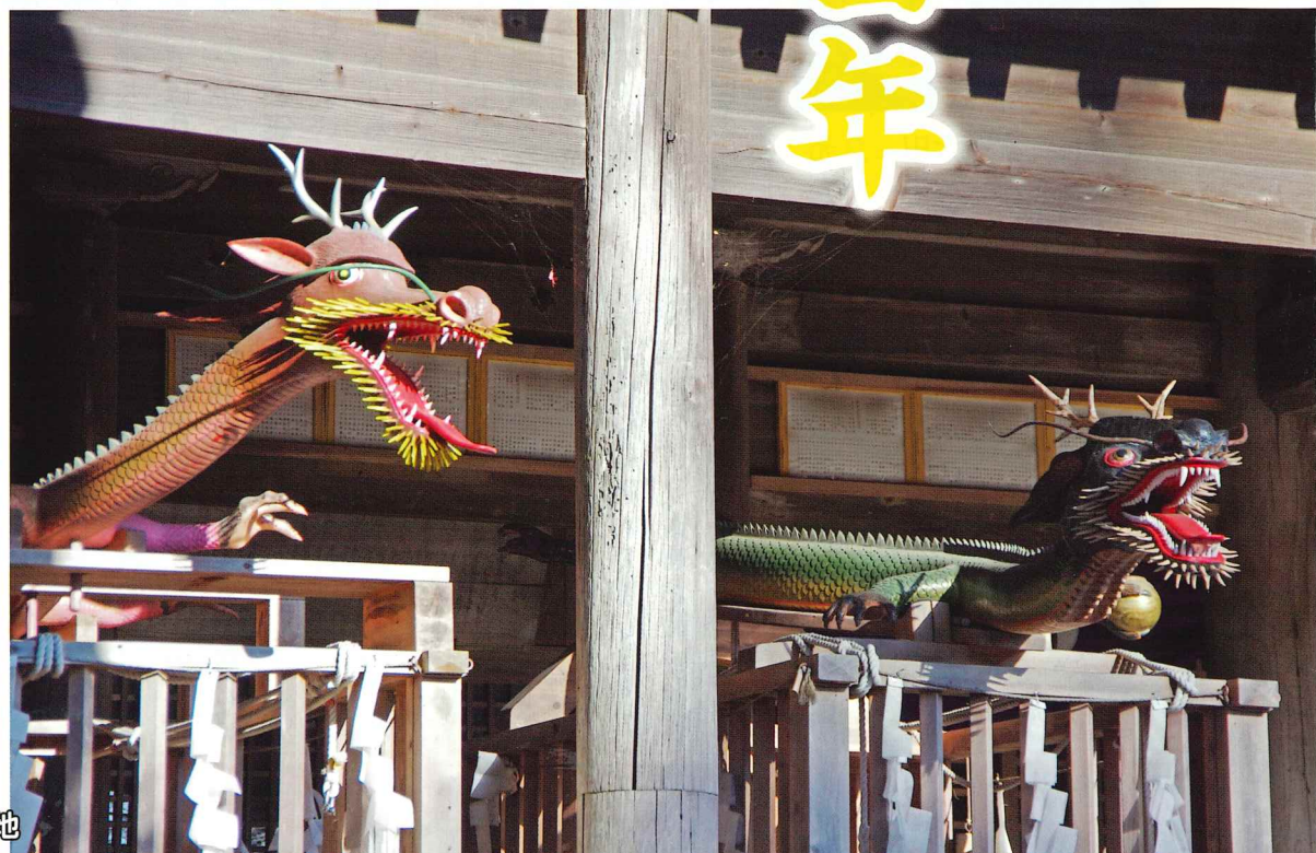
周南市大字須々万本郷312番地