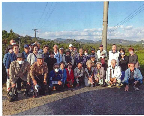
茶畑の前で記念撮影しました

さてさて、今年はどこにいきましようか。ここに行ってみないかというリクエストがありましたらぜひお寄せください。なお、今回の参加者の方から紀行文をお寄せいただいたので、P6の「みんなの広場」で紹介させていただきます。こちらもぜひご一読ください。