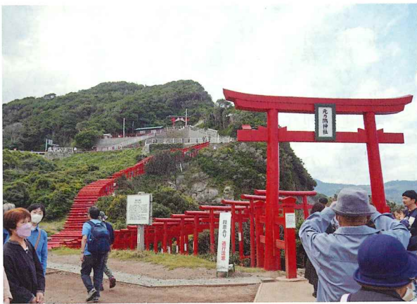
元乃隅神社のシンボル・朱塗りの鳥居の列

久しぶりとあって、たちまち定員80人に達し、好天に恵まれた10月15日、バス2台に分乗して、早朝、一路山陰・長門方面