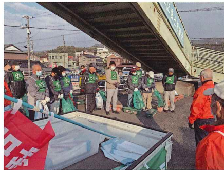
ゴミのない町に（福川地区）

富田・福川地区ではともに町の顔でもある駅前周辺の清掃に汗を流しました。本部の岐山通りの清掃では、市のシンボルロ