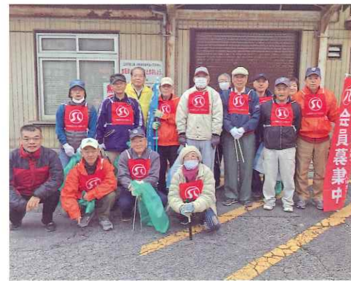
参加された福川地区の皆さん