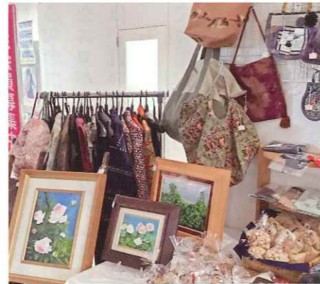
会員の作品展示・販売

私も八十路に入った今、体力知力の衰えは隠せません。朝の散歩、スクワット等、焦らずに今していることを根気よく継続することに努めようと思いましたが。 自分を信じ、負けない心を持ち続け、努力し、人の役に立っていたか?感謝されたか?自問自答して明日に繋げていきたいです。