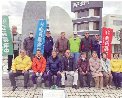
参加された富田地区の皆さん