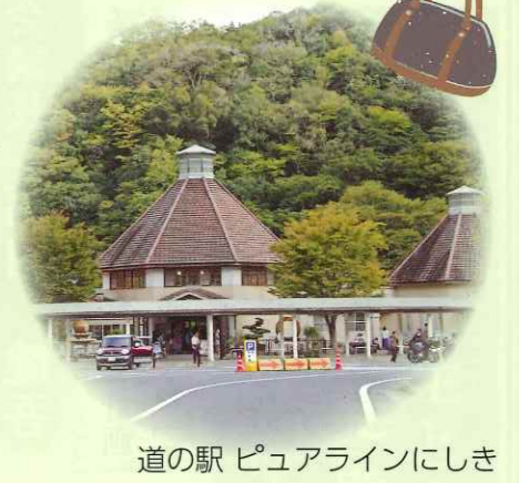
道の駅ピュアラインにしき