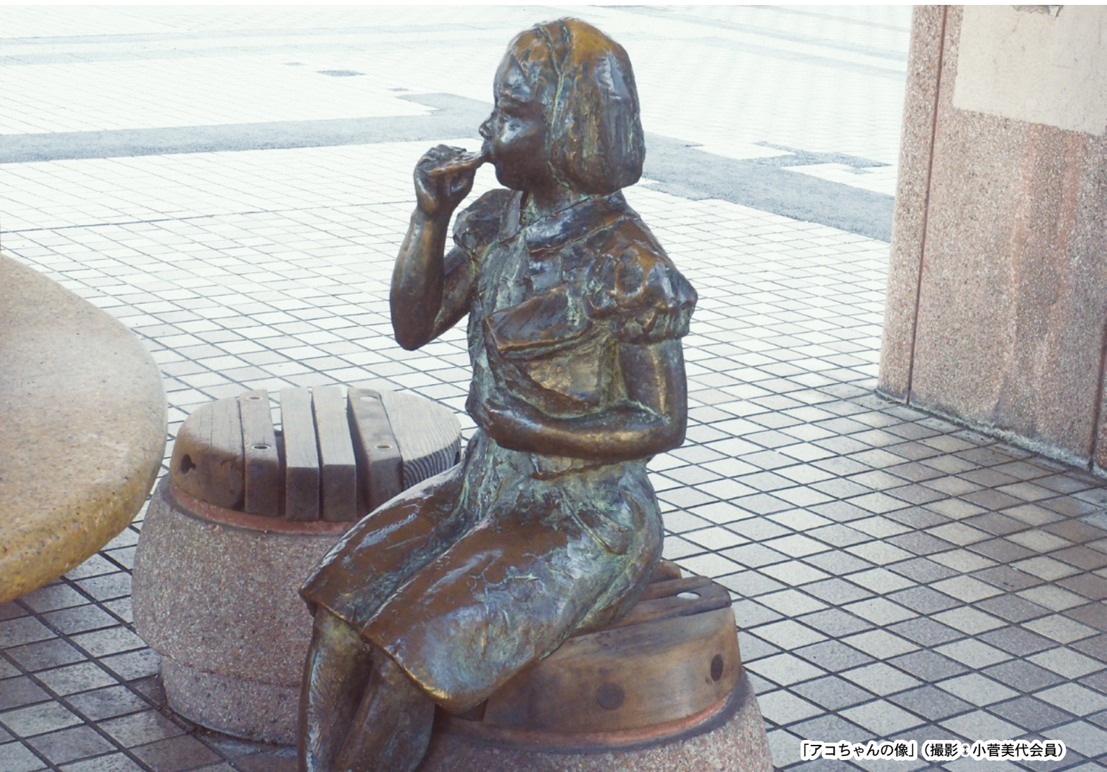
「アコちゃんの像」