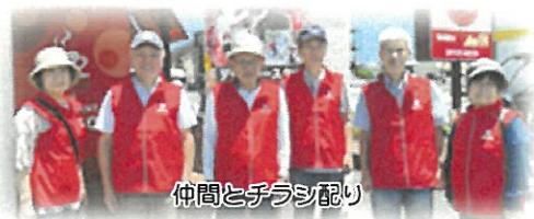
仲間とチラシ配り