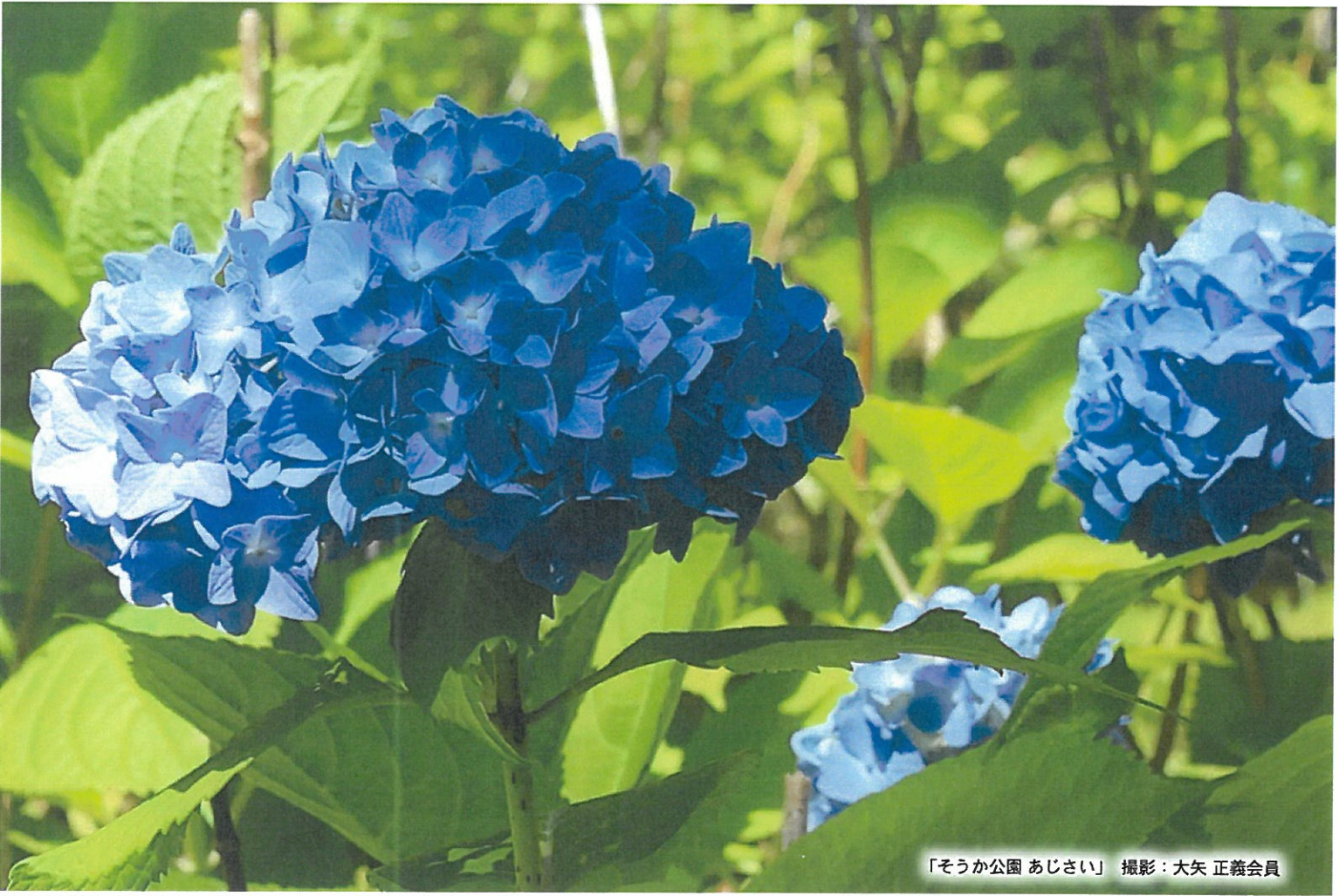
「そうか公園 あじさい」