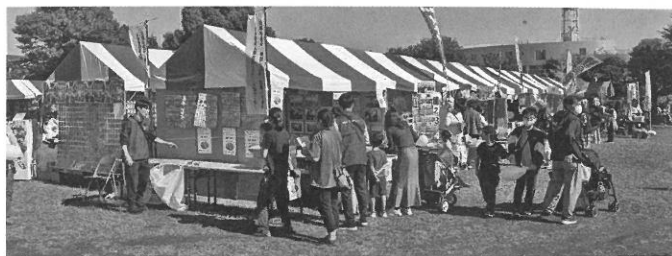
シルバー人材センターPRブース

またYEGランドでは、子ども向けアトラクションの整列・案内スタッフとしてボランティア協力をしました。 【運営協力】会員、役職員 合計35名