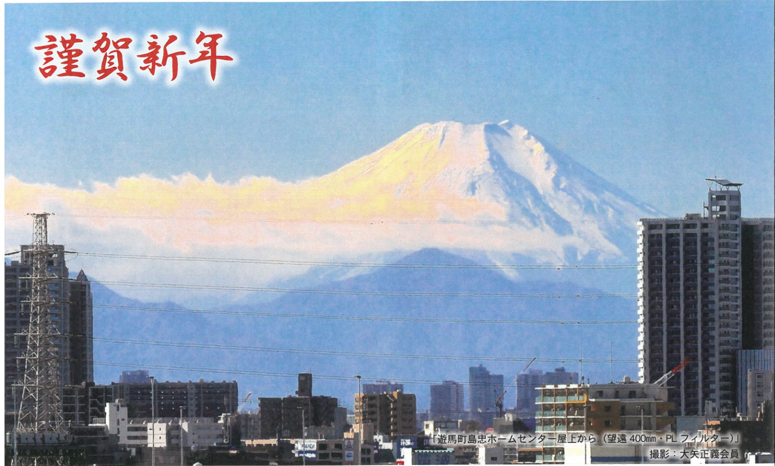
「遊馬町島忠ホームセンター屋上から（望遠 400mm・PL フィルター）」