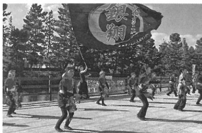
よさこい銀翔の演舞