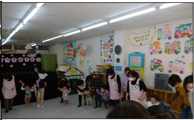
午後の部は輪になって大きな太鼓を楽しみました