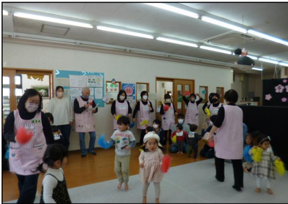
午前の部はポンポン体操を踊りました