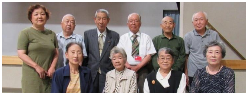
佐阿齋熱丹畠 藤部藤海野山 高伊早松 橋藤坂本

最後に私が気づいたこと。コロナウイルス消毒作業の件、人間の嫌な面をみんな見て来ました。初めてこのような場面にあって唾然としました。今までも色々な方とお付き合いして来ましたが初めてでびっくりしました。でも見て下さっている方々がいらっやいました。学校の先生方でした。校長先生から感謝のお手紙頂きました。