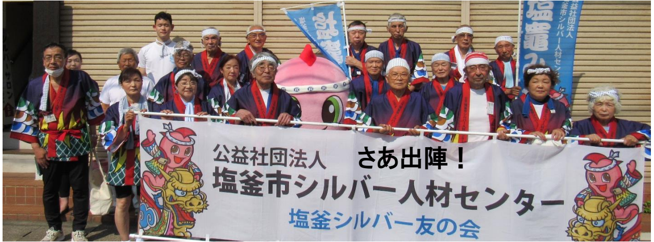
公益社団法人 さあ出陣！ 塩釜市シルバー人材センター 塩釜シルバー友の会